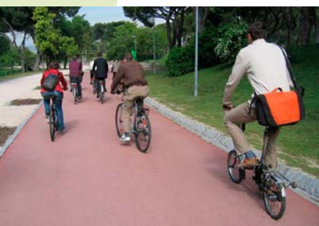
Dehesa de la Villa