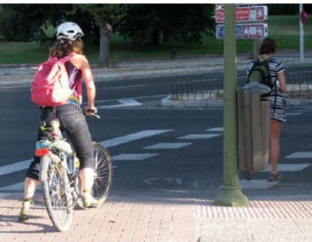
Cruce del Parainfo