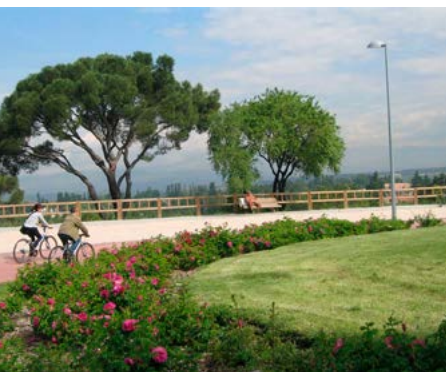
Dehesa de la Villa