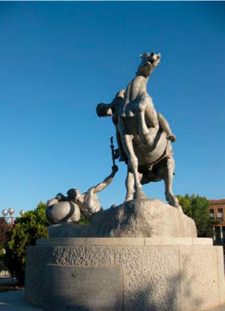
Plaza de Medicina