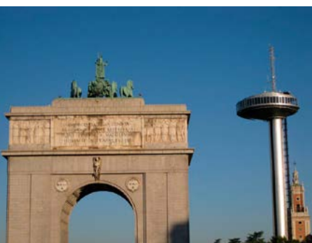
Arco y faro de Moncloa

Además de la ruta a pie o en bici que te proponemos, en un radio inferior a un kilómetro de distancia existen enclaves muy interesantes desde el punto de vista urbanístico y paisajístico.