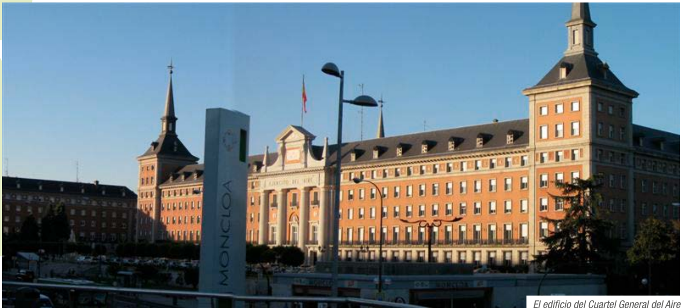
El edificio del Cuartel General del Aire

El campus de la Ciudad Universitaria de Madrid que agrupa a la Universidad Complutense, a la Universidad Politécnica y a la UNED es uno de los más extensos de Europa. Su origen data de comienzos del siglo XX como una zona donde poder agrupar todos los edificios de las facultades universitarias que hasta entonces se encontraban dispersas por el casco antiguo de Madrid. Hoy la Ciudad Universitaria es una zona valiosa desde el punto de vista urbanístico y paisajístico y en sus proximidades se encuentran zonas verdes como la Dehesa de la Villa, el Parque del Oeste o la Casa de Campo.