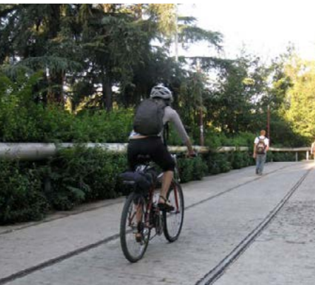
La antigua vía del tranvía