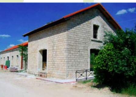
Estación de Ambite

Km. 40. Estamos en Orusco, otro de los pequeños y hospitalarios pueblos del valle, desde aquí y hasta llegar a Ambite vamos a disfrutar de uno de los mas bonitos tramos de la Vía Verde.