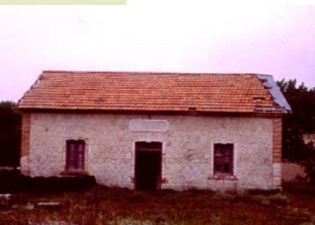
Estación de Chavarrí

Km. 23. Llegamos a Perales del Río. La Vía Verde rodea por el sur el casco urbano del municipio ya que el trazado ferroviario original se ha perdido. El carril bici nos permite llegar fácilmente bajo el trazado de la A-3 que cruzaremos de nuevo, esta vez en dirección a Tielmes. Justo en este punto y sobre unos acantilados de yeso podemos ver las celebres viviendas-cueva excavadas hace cientos de años.