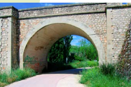
Puente de Orusco

Km. 30. Hace un buen rato que hemos dejado atrás el casco urbano de Tielmes así como una pequeña ermita junto a la ruta. Mas adelante y junto a la carretera es posible ver el edificio de la antigua estación de Chavarrí que daba servicio al balneario y planta embotelladora de las célebres “Aguas de Carabaña”.