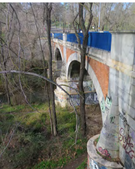
Puente de los Capuchinos

Viaducto del ferrocarril (kilómetro 1,90). Este paraje es uno de los más icónicos de todo el itinerario debido a la elegancia de esta infraestructura de hormigón y hierro finalizada en 1964. Parada para hacer fotos y seguimos ruta camino a El Pardo.