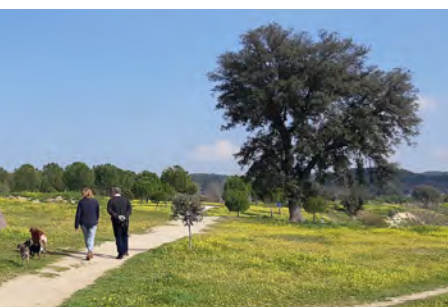
Meandro de Mingorrubio

Meandro de Mingorrubio (kilómetro 6,00). El Manzanares gira a la izquierda (oeste) marcando una gran curva. Podemos seguir las sendas de pescadores pegadas a la orilla o el camino más elevado que discurre por las terrazas del meandro.