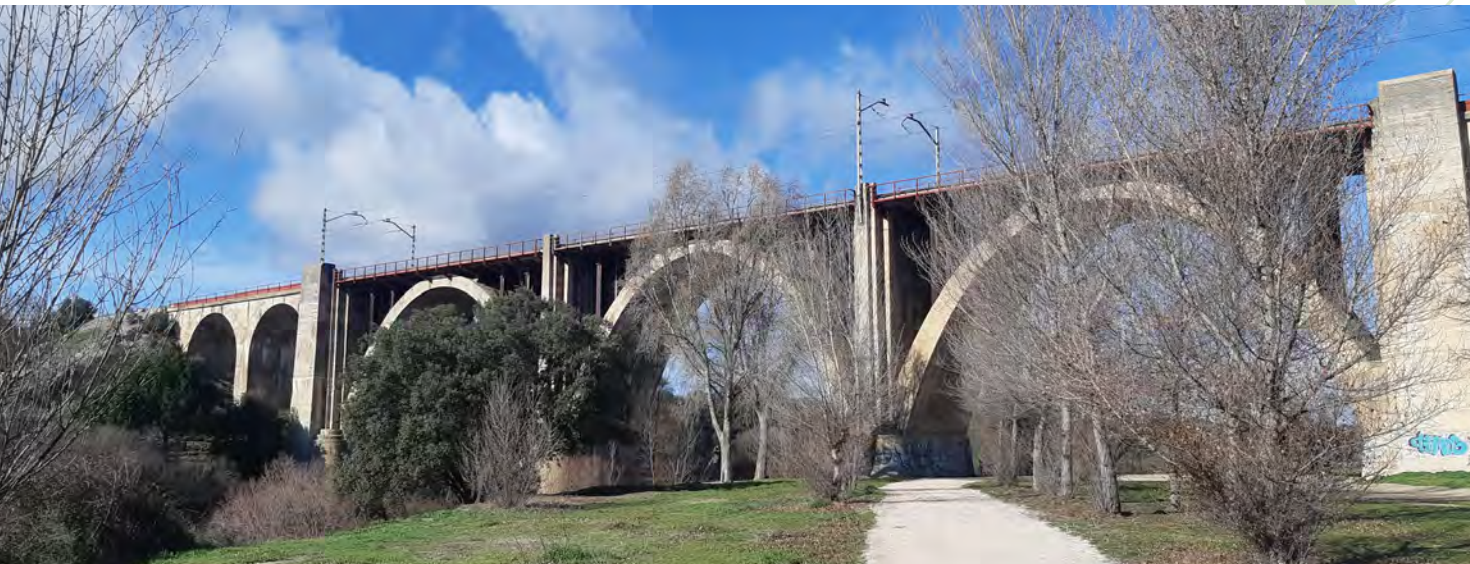
Viaducto del ferrocarril