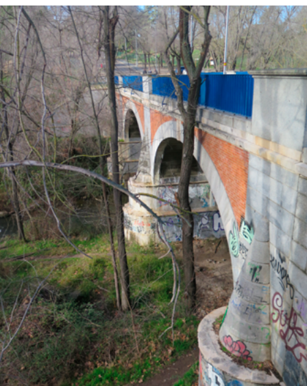
Puente de los Capuchinos

Viaducto del ferrocarril (kilómetro 1,90). Este paraje es uno de los más icónicos de todo el itinerario debido a la elegancia de esta infraestructura de hormigón y hierro finalizada en 1964. Parada para hacer fotos y seguimos ruta camino a El Pardo.