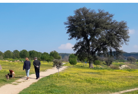
Meandro de Mingorrubio

Meandro de Mingorrubio (kilómetro 6,00). El Manzanares gira a la izquierda (oeste) marcando una gran curva. Podemos seguir las sendas de pescadores pegadas a la orilla o el camino más elevado que discurre por las terrazas del meandro.