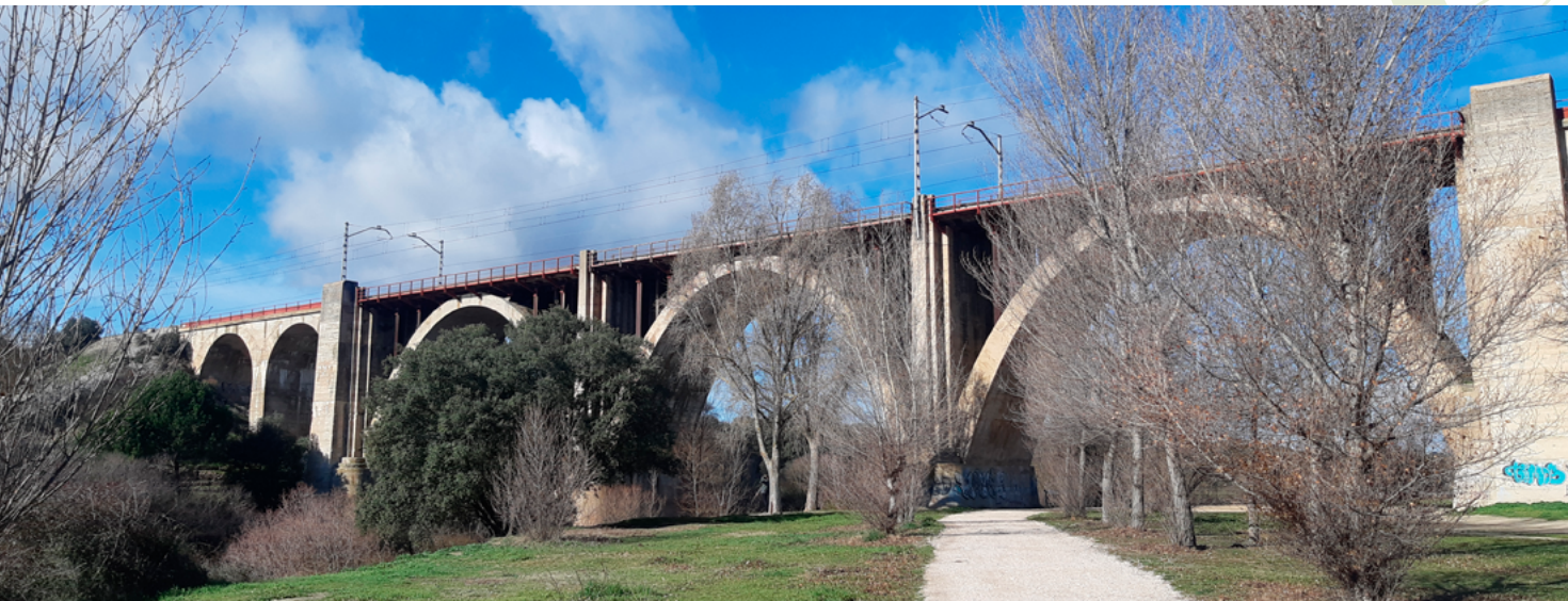
Viaducto del ferrocarril