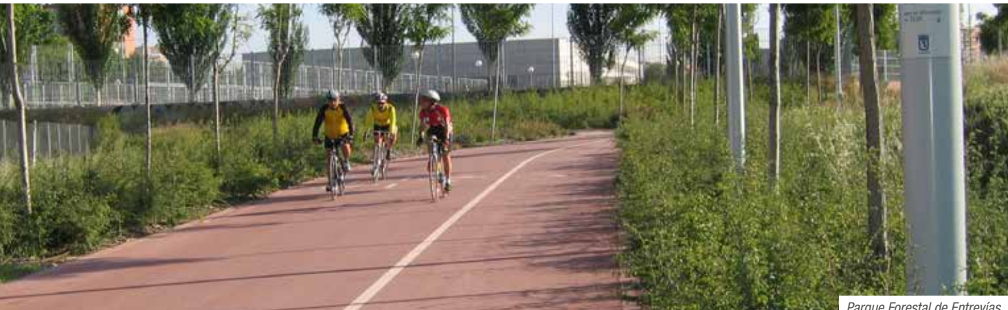
Parque Forestal de Entrevías