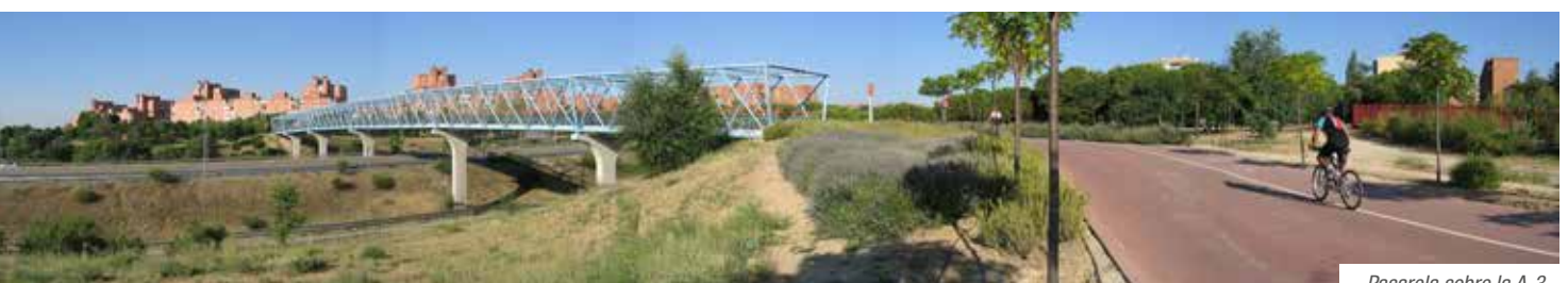
Pasarela sobre la A-3