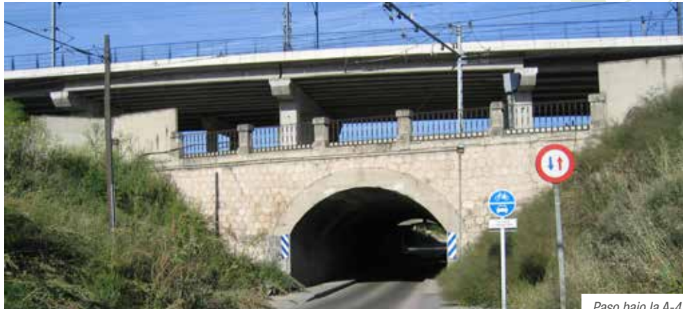
Paso bajo la A-4

Puente bajo la avenida de la Albufera (kilómetro 8,0). Estamos recorriendo el llamado Parque Lineal de Palomeras. A la derecha se encuentra el metro de Miguel Hernández y a la izquierda la Villa de Vallecas.