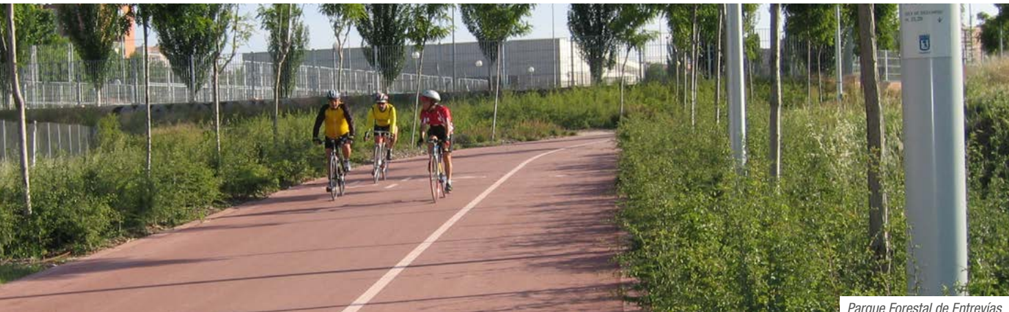
Parque Forestal de Entrevías