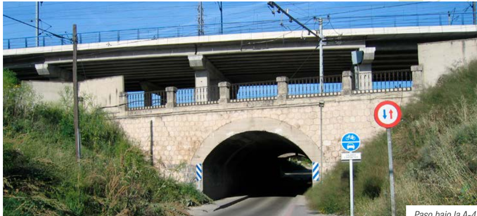
Paso bajo la A-4

Puente bajo la avenida de la Albufera (kilómetro 8,0). Estamos recorriendo el llamado Parque Lineal de Palomeras. A la derecha se encuentra el metro de Miguel Hernández y a la izquierda la Villa de Vallecas.