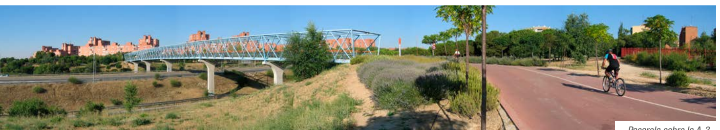
Pasarela sobre la A-3