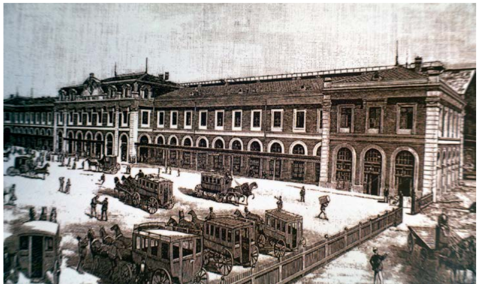
Príncipe Pío. Cabecera de la línea de Majadahonda

La estación de Majadahonda pertenece a la línea ferroviaria que comunicaba Madrid con Francia a través de Irún. Esta línea es una de las más antiguas de España, habiéndose conmemorado los 150 años desde que el primer tren de la línea saliera de la madrileña estación de Príncipe Pío. En aquellos años, el marqués de Remisa construyó un apeadero de tren en su finca. Éste es el origen de la actual estación de Cercanías de la localidad.