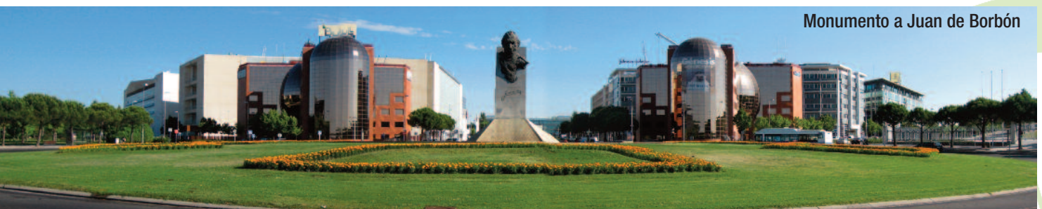
Monumento a Juan de Borbón