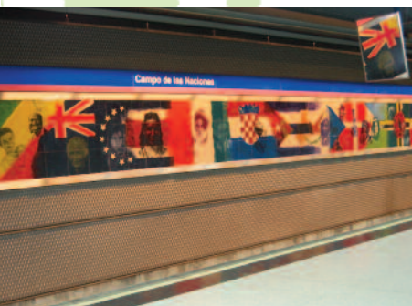
Mural de Campo de las Naciones

La estación de Feria de Madrid, hasta mediados de 2017 llamada Campo de las Naciones, pertenece a la línea 8 de Metro de Madrid y fue inaugurada en 1998 como parte de línea de enlace desde el centro de Madrid al aeropuerto de Barajas. Esta línea se vio ampliada en 2002 con el tramo de conexión a Nuevos Ministerios y completada en 2007 con la extensión por el norte a la Terminal T4 del aeropuerto. Campo de las Naciones es una de las estaciones más singulares de la red, no solo por su funcionalidad y accesibilidad sino también por disponer de un único andén central y sendos murales a cada lado de la vía ocupando toda la longitud de la estación. Se trata de una colorista obra cerámica realizada por Ralphe Sardá y Carlos Alonso con el título “Rostros de las naciones, una sola bandera” que además incluye y unifica con gran sensibilidad artística todas las banderas del mundo.