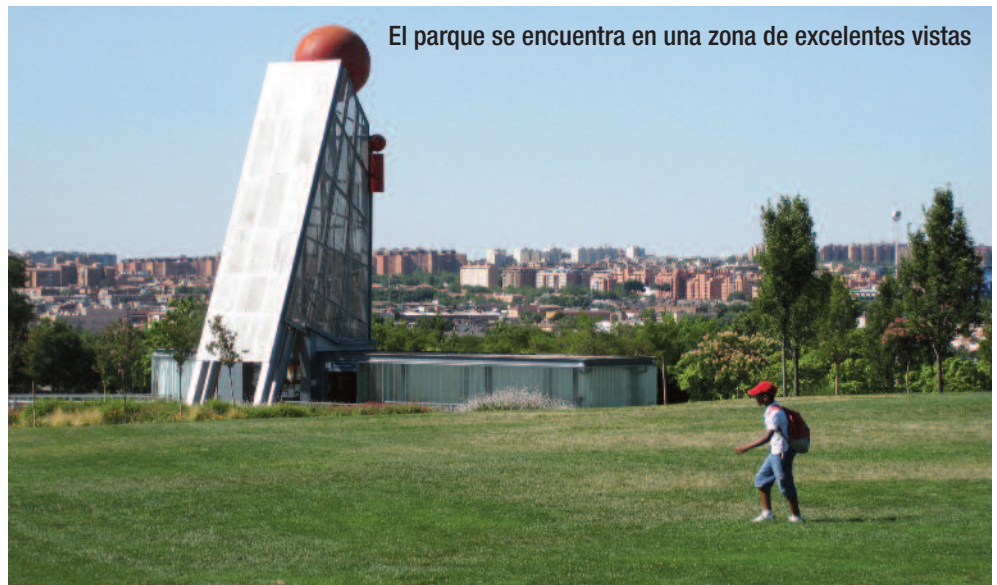
El parque se encuentra en una zona de excelentes vistas

El Parque Juan Carlos I es una zona verde relativamente moderna ya que apenas cuenta con 20 años de antigüedad y sin embargo se ha consolidado como destino favorito de muchos madrileños que pasean o pedalean por su red de cuidados caminos o reman en sus rías y estanques. El parque tiene una extensión de 160 hectáreas y por tanto es el segundo parque más grande de la capital, por delante del Parque del Retiro (que tiene 118 hectáreas) y sólo por detrás de la Casa de Campo. El parque Juan Carlos I fue abierto al público en el año 1992 con motivo de la celebración de Madrid como Capital Europea de la Cultura. En sus proximidades, en la Alameda de Osuna se encuentra otro parque de gran valor histórico: El Capricho.