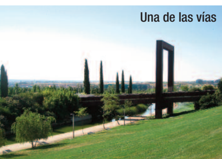
Una de las vías

El palacio Municipal de Congresos. El edificio del Palacio Municipal de Congresos es obra de Ricardo Bofill y fue inaugurado en el año 1993 dentro del contexto urbano del llamado Campo de las Naciones. En la actualidad su gestión recae en la Empresa Municipal Campo de las Naciones. Tiene una superficie de más de 30.000 m 2 sobre un total de 14 plantas con la singularidad de que 7 de las mismas son subterráneas. El edificio es sobrio, funcional y con su fachada de piedra blanca no deja indiferente a nadie. Entre otros eventos ha albergado reuniones de OTAN, la Unión Europea, el FMI o galas festivas como la entrega de los premios Goya.