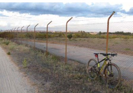
Recinto Club Militar La Dehesa

Calle Sanchidrián con Darío Gazapo (kilómetro 0,7). En la esquina que conforman ambas calles veremos una barrera que da acceso a una pista de tierra que entra en el llamado “Entorno Meaques-Retamares”, el primero de los grandes espacios, descontando la casa de Campo, que conforman el corredor ecológico del suroeste. Seguimos la pista de tierra, un paseo muy habitual entre los vecinos del barrio.