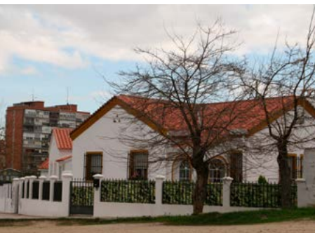
Colonia Arroyo Meaques