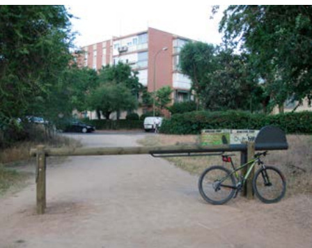
Barrera de acceso

Metro Colonia Jardín (kilómetro 0). Salimos de la estación por el acceso que comunica con la Colonia Gran Capitán. Comenzamos a caminar o pedalear hacia el oeste por la calle Sanchidrián que marca el límite entre los bloques en altura y las casitas bajas de la colonia Arroyo Meaques. Este primer tramo por asfalto también se puede realizar callejeando entre las coquetas casitas que conforman este singular núcleo residencial. Conexión Ruta Verde RV-06