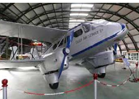
Museo del Aire

Colonia militar Arroyo Meaques. La génesis de esta singular colonia es posterior a la Guerra Civil. El barrio fue construido en las proximidades de los grandes cuarteles de la carretera de Extremadura. La finalidad de esta colonia era dar alojamiento a las familias de oficiales y suboficiales del Ejército de Tierra. Los tipos edificatorios en esta colonia son muy parecidos a los de una casa de campo: una edificación principal pequeña y alguna edificación auxiliar con un pequeño jardín. Todas las viviendas se agrupan entorno a una plaza y su apariencia es la de un pequeño pueblo ubicado en plena ciudad.