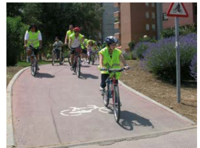
Saliendo de La Serna