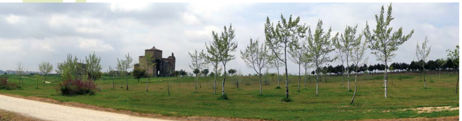
Ermita de San Pedro

Bosquesur y Arroyo Culebro. Esta zona se ha consolidado como un gran corredor verde para toda la zona completando la oferta de otras importantes áreas verdes, como el cercano parque de Polvoranca. El Parque Forestal del Sur (Bosquesur), proyectado por la Consejería de Medio Ambiente, ha permitido la regeneración de una vasta extensión de terreno antaño degradada (escombreras, áreas agrícolas abandonadas, etc.), mediante la recuperación de la cubierta forestal con