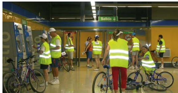
Estación de Puerta del Sur

La estación de Puerta del Sur es una de las más importantes de Alcorcón ya que posibilita el transbordo entre las líneas 10 y 12 (MetroSur). Abierta en 2003, tiene un espectacular diseño gracias a la presencia de enormes murales. En el otro extremo de la ruta visitaremos La Serna, estación de Fuenlabrada perteneciente a la línea C5 de Cercanías e inaugurada en 1974.