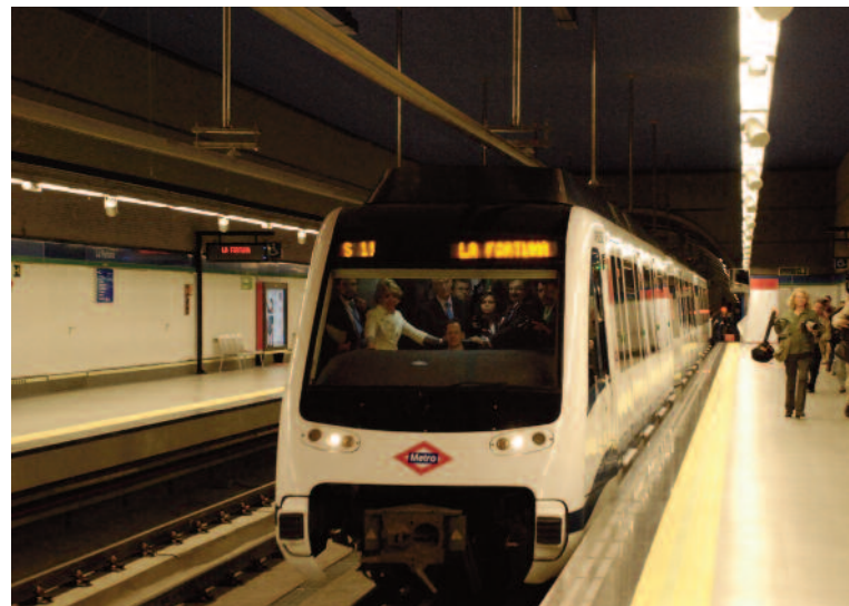
Estación de La Fortuna en octubre de 2010

La estación de Metro de la Fortuna se puso en servicio en octubre de 2010, conectando a los vecinos del barrio con Plaza Elíptica (Intercambiador y línea 6) en apenas 15 minutos. Las obras del metro supusieron una importante remodelación del barrio, incluida la mejora y ampliación del parque de Serafín Díez Antón.