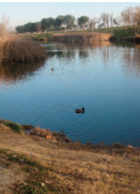
Lago de Butarque