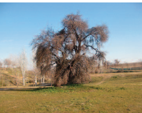
El paisaje del Butarque esconde parajes muy diversos.

Extremo occidental de la ruta (kilómetro 3). Rodeamos las láminas de agua de Las Presillas y giramos totalmente a la izquierda para cambiar de sentido y seguir por la orilla derecha del Butarque en descenso hacia el este. Volveremos, de nuevo, a ver el barrio de La Fortuna esta vez con una perspectiva distinta, justo en la orilla opuesta y elevado sobre una meseta.