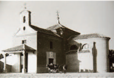
Ermita de Butarque

Además de la ruta a pie o en bici que se inicia allí, en la zona existen enclaves muy interesantes desde el punto de vista urbanístico y paisajístico.