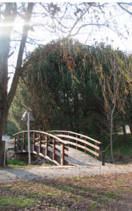
Pasarela para caminantes y ciclistas

Estación de La Fortuna (kilómetro 0). Salimos de la estación y caminamos hacia el este por el parque Serafín Díez y, posteriormente, por los jardines de García Lorca. Aquí comenzamos a descender hacia el valle del Butarque que vemos más abajo.