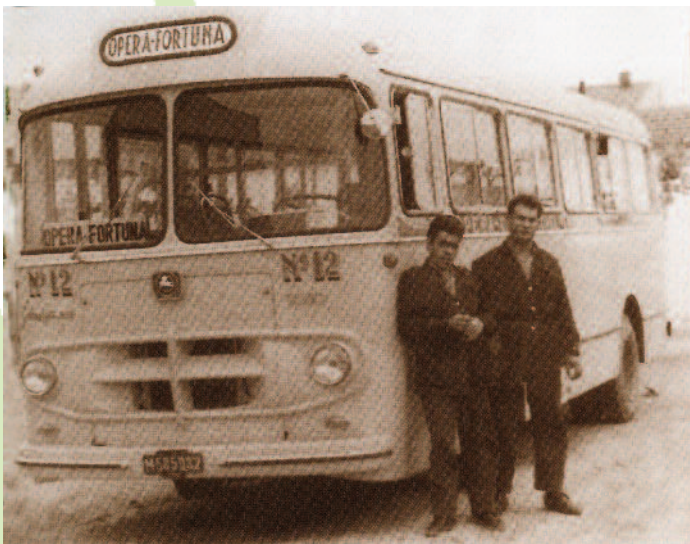
Las "camionetas" periféricas al barrio