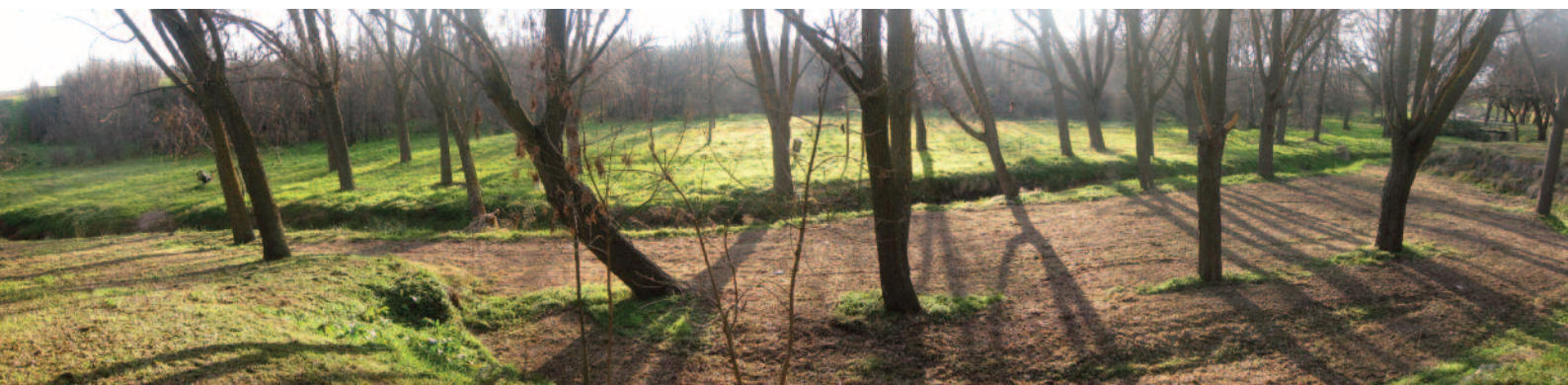
Atardecer de invierno

Más información en la web del Ayuntamiento de Leganés www.leganes.org .