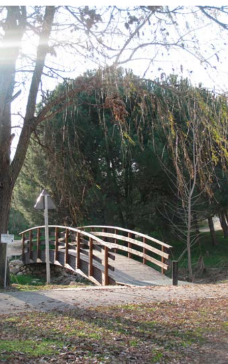
Pasarela para caminantes y ciclistas

Estación de La Fortuna (kilómetro 0). Salimos de la estación y caminamos hacia el este por el parque Serafín Díez y, posteriormente, por los jardines de García Lorca. Aquí comenzamos a descender hacia el valle del Butarque que vemos más abajo.