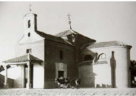
Ermita de Butarque

Además de la ruta a pie o en bici que se inicia allí, en la zona existen enclaves muy interesantes desde el punto de vista urbanístico y paisajístico.