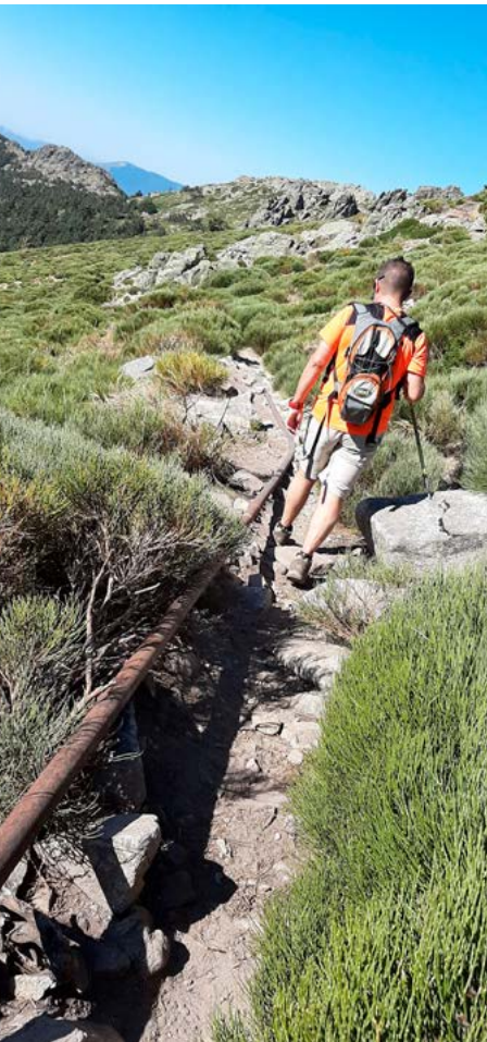
Camino de las Tuberías