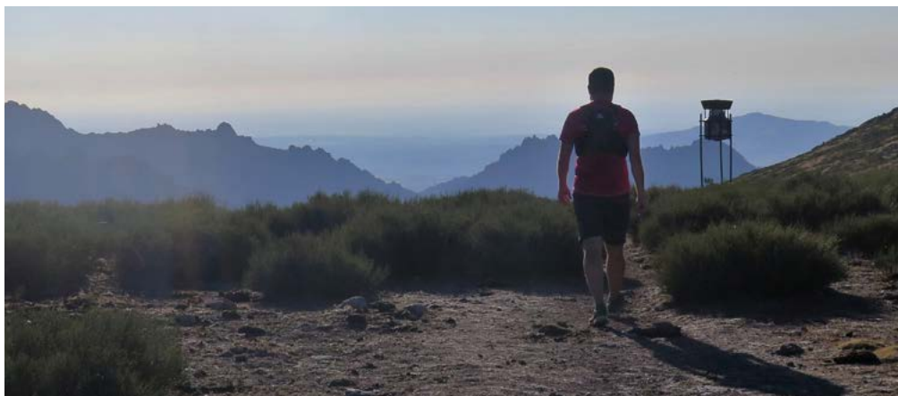
Collado del Piornal

Fuente de la Campanilla (kilómetro 6,0). Abandonamos definitivamente la pista justo a la altura del monolito que marca la entrada al Parque Nacional de Guadarrama. Giramos a la derecha, ascendemos por el sendero y nos refrescamos en la fuente de la Campanilla. Comienza la dura subida por un sendero hasta el collado del Piornal.