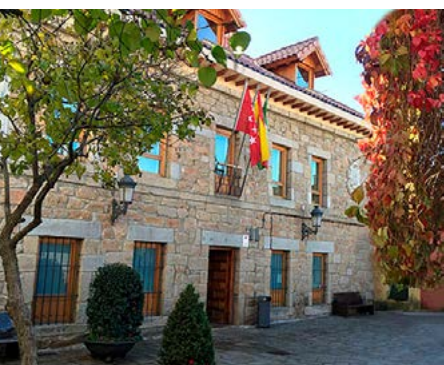
Ayuntamiento de Navacerrada

Navacerrada (kilómetro 0). Partimos de la plaza del Ayuntamiento en dirección a la calle de las Eras. En esta misma calle se encuentra la terminal de la línea 691. Salimos del pueblo cruzando la rotonda de la M-607.