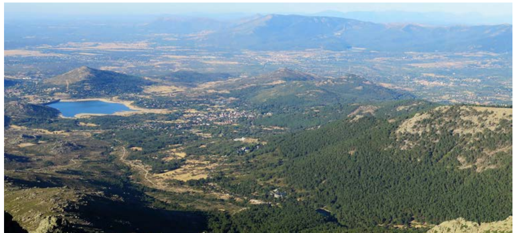
Valle de La Barranca

Utilizaremos, tanto al comienzo como al final de la ruta, los servicios de las líneas interurbanas del Consorcio Regional de Transportes. Desde Madrid al pueblo de Navacerrada viajaremos en la línea 691 (Grupo Avanza) que parte del Intercambiador de Moncloa.