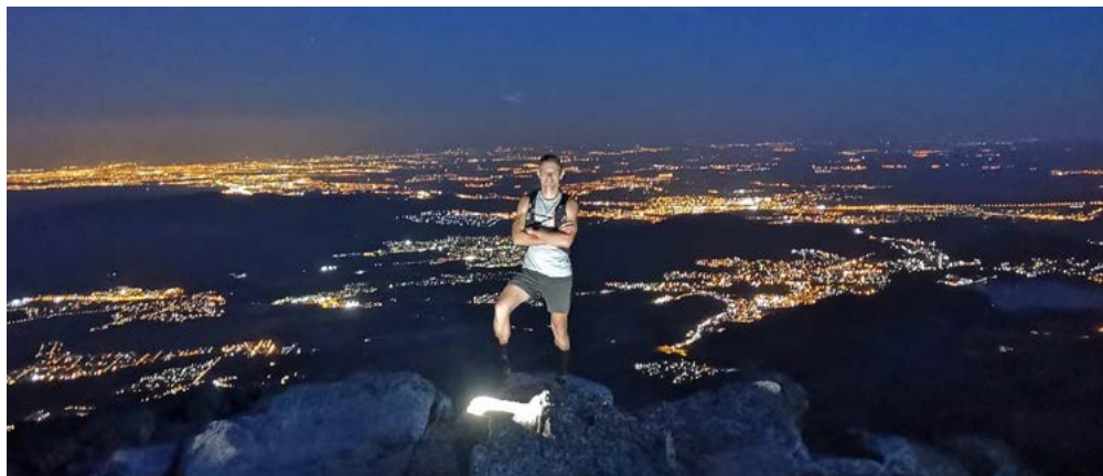
Visión nocturna desde la cima de la Maliciosa

La Maliciosa. El fuerte desnivel de su cara sur y su rotunda morfología hace que sea un pico reconocible desde la ciudad de Madrid. Su perfil gris azulado salpicado de neveros sirvió de telón de fondo para que Velázquez pintara el retrato del príncipe Baltasar Carlos a caballo. En el siglo XV aparece la denominación de “La Maldecida” para una cumbre atacada por los vientos y la nieve en invierno y por el implacable sol del verano. Estamos, sin duda, ante la cima más legendaria y uno de los mejores miradores de Guadarrama.