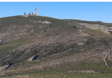
Bola del Mundo