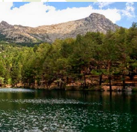
Valle de La Barranca

Desvío Cuerda de las Cabrillas (kilómetro 12,8). En una amplia curva abandonamos la pista hormigonada y giramos a la izquierda para bajar por un sendero que se encamina a la “Cuerda de las Cabrillas”, una alineación montañosa que separa el valle de la Barranca del valle del Regajo del Puerto por donde discurre la M-601.