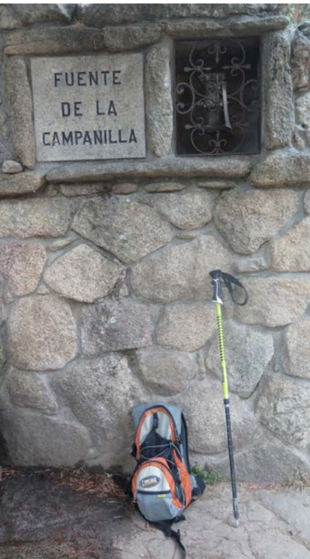
Fuente de la Campanilla