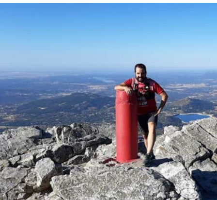
Cima de La Maliciosa