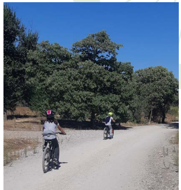
Pedaleando junto al Jarama