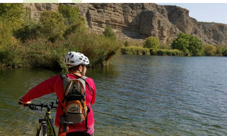
Laguna del Campillo

La Laguna del Campillo. Cuesta trabajo creer que un paraje natural tan bonito es consecuencia de la actividad humana, en concreto de la extracción de grava y arena para la construcción. Justo en su orilla meridional se encuentra el Centro de Interpretación de la Naturaleza de la Comunidad de Madrid.