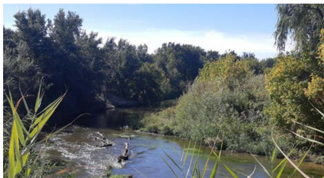
Río Manzanares, metros antes de unirse al Jarama

Estación de Rivas Vaciamadrid (kilómetro 13,5). Final de la ruta. Conexión Rutas Verdes: RV-2.1 , RV-2.3 , RV-3.1 y RV-3.2 .