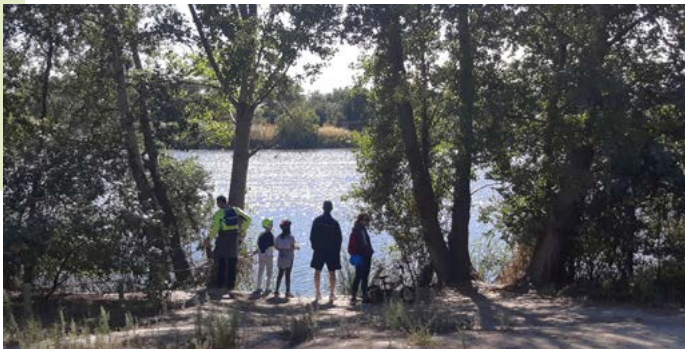
Laguna del Soto (a 15 minutos de la estación de Metro de Rivas Vaciamadrid)

A finales del siglo XIX un ferrocarril de vapor de vía estrecha, el popular “Tren de Arganda, que pita más que anda”, atravesaba toda esta zona. Dicho tren tenía su origen en la madrileña estación del Niño Jesús, muy cerca del Retiro. En los años setenta del siglo XX esta línea pasa a ser el ferrocarril de la cementera Portland y en 1998 parte de su trazado se transforma en la actual línea 9 de Metro de Madrid.