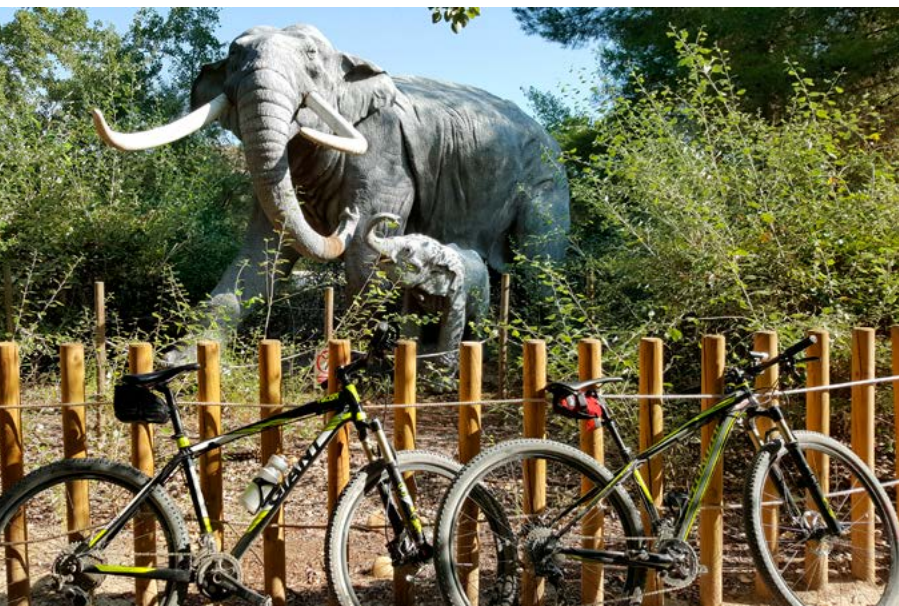
Centro de Interpretación de la Naturaleza

El antiguo Ferrocarril del Tajuña. En el entorno de la laguna del Campillo se ha conservado un tramo del antiguo ferrocarril que es explotado con fines turísticos por la asociación "Vapor Madrid". Su base de operaciones se encuentra en La Poveda donde cuentan con una coqueta estación, taller de restauración de trenes y un pequeño museo. Viajar en este tren es una actividad más que recomendable si vienes a hacer esta ruta.