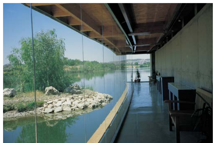
Centro de Interpretación de la Naturaleza