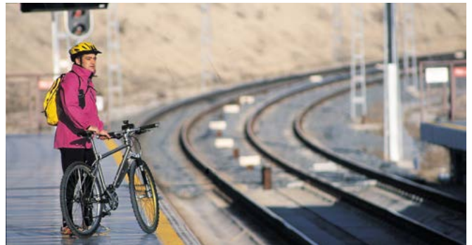
Estación de Rivas Vaciamadrid