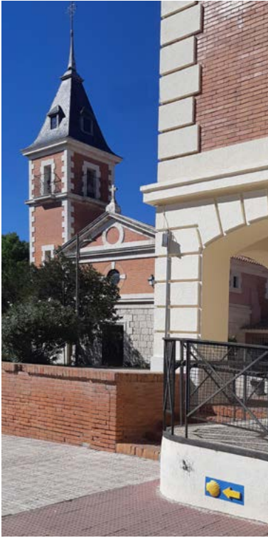
Iglesia de Rivas

Se trata de un excelente lugar para comprender la génesis y funcionamiento de los diferentes ecosistemas de la zona.