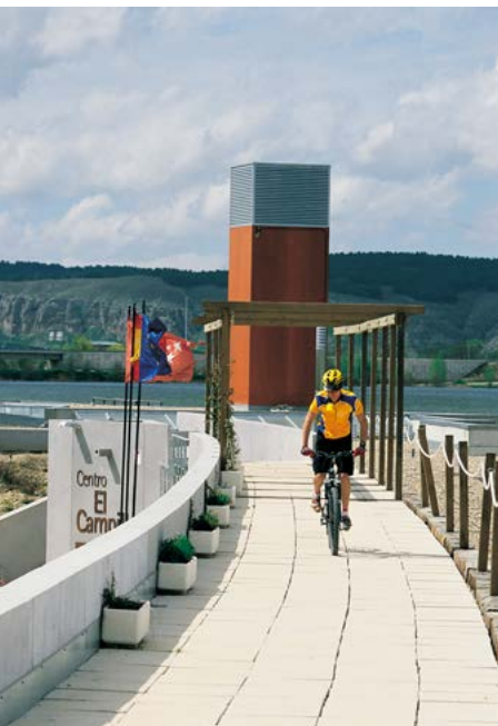
Centro de Interpretación de la Naturaleza

Metro Rivas Vaciamadrid (kilómetro 0). Salimos de la estación dirección su- reste. Atravesamos una rotonda y tomamos una carretera que discurre paralela a la vía del Metro (derecha) y al casco histórico de Rivas (izquierda).