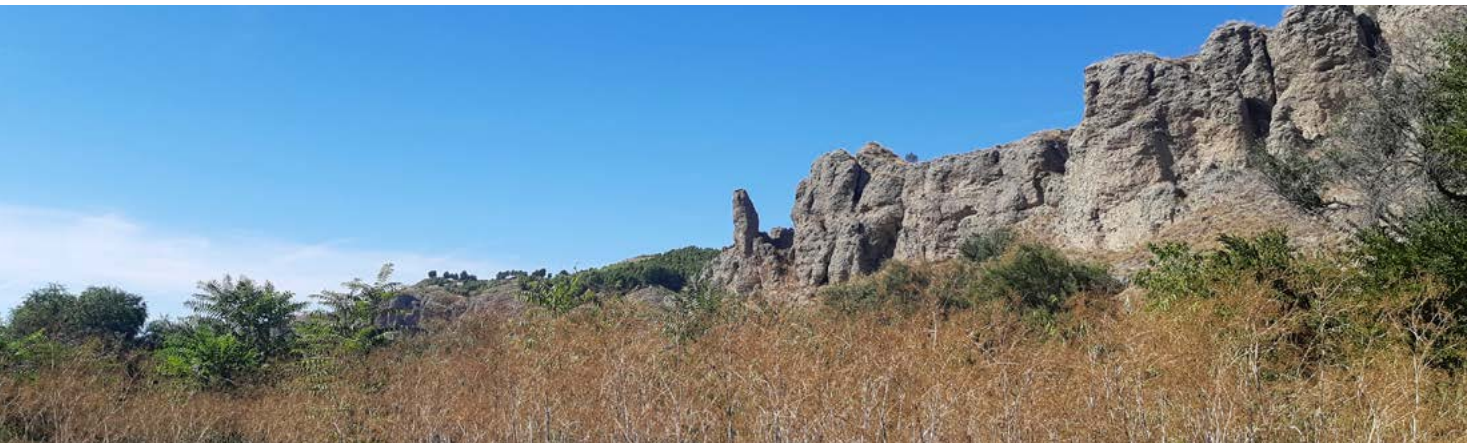
Cortados de La Marañosá