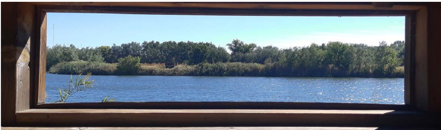
Observatorio de aves en la Laguna del Soto

Desvío al Centro de Interpretación de la Naturaleza (kilómetro 2,7). El ac- ceso a la izquierda nos invita a visitar el CIN de El Campillo. Un espectacular mamut y su cría reciben al visitante. El edificio es muy impactante y su galería acristalada permite tener unas vistas privilegiadas de la laguna. Una vez visita- do el centro volvemos a la entrada y seguimos a la izquierda.