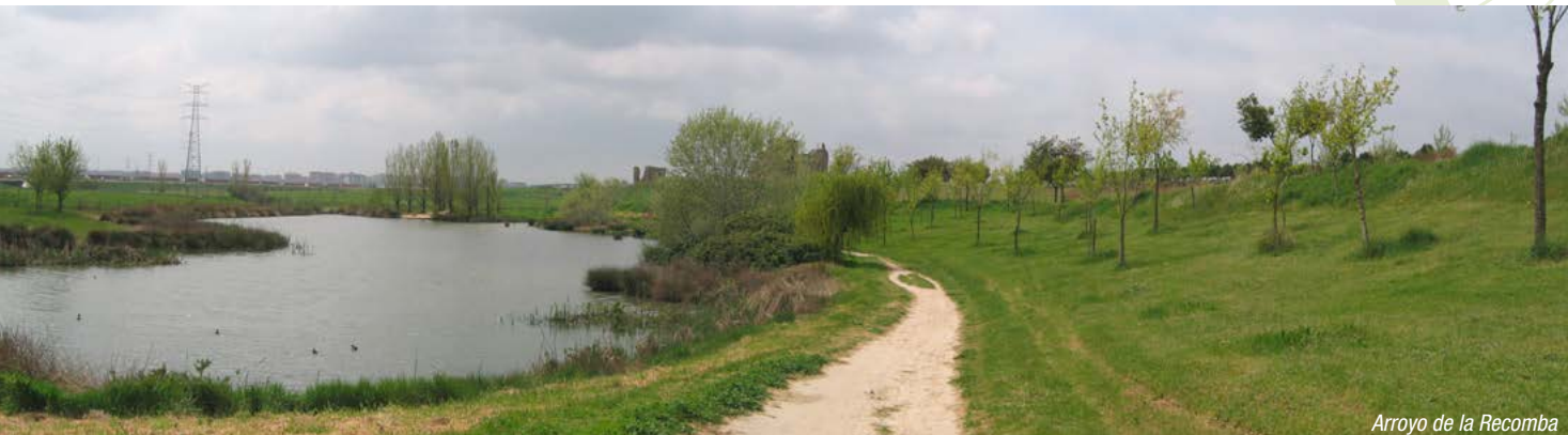
Arroyo de la Recomba