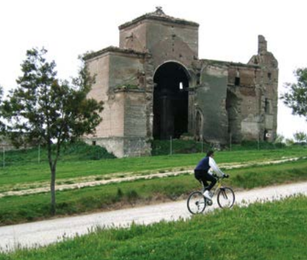
Iglesia de San Pedro

El Parque de Polvoranca. Su ubicación como centro neurálgico de los grandes municipios de la zona y la proximidad a estaciones de MetroSur y de Cercanías, hacen de Polvoranca un espacio verde muy accesible a los ciudadanos. Sugerimos visitar el Centro de Educación Ambiental, donde existe información detallada del mismo ya que estamos hablando de un gran parque en la zona sur de Madrid. Junto al Centro de Educación Ambiental se encuentran diversos jardines temáticos como el Jardín de Rocas o el Botánico.