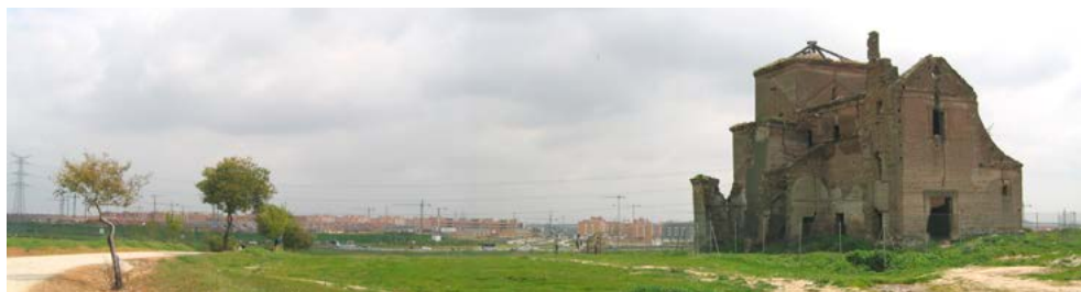
Iglesia de San Pedro

El Barrio de Arroyo Culebro. Es uno de los barrios más jóvenes de Leganés y tiene una extensión de 132 hectáreas. Combina los chalets adosados con bloques de pisos de tres alturas y está surcado por el arroyo del mismo nombre, que nace en el vecino parque de Polvoranca y que conforma un bonito parque lineal. Es una zona muy bien planificada que cuenta con anchas calles y numerosas zonas verdes. Destaca su largo bulevar que nace en la zona norte del barrio y acaba en la plaza. En la actualidad viven en el barrio unos 8.000 vecinos que disponen desde 2004 de estación de Cercanías.