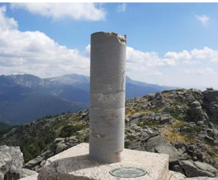
Vértice geodésico de La Peñota

La Peñota. Estamos ante otra de las montañas icónicas del Guadarrama. En realidad se trata de un conjunto de tres cimas situándose en una de ellas el vértice geodésico (1.945 m). La Peñota es un espectacular mirador de la Sierra, sobre todo si miramos hacia el sur donde se extiende la llanura a más de 800 metros por debajo de la cumbre. Este pico, que forma parte del límite administrativo entre Madrid y Segovia, es un importante hito del sendero de gran recorrido GR-10 que nos conduce desde aquí al Alto del León y San Lorenzo de El Escorial.