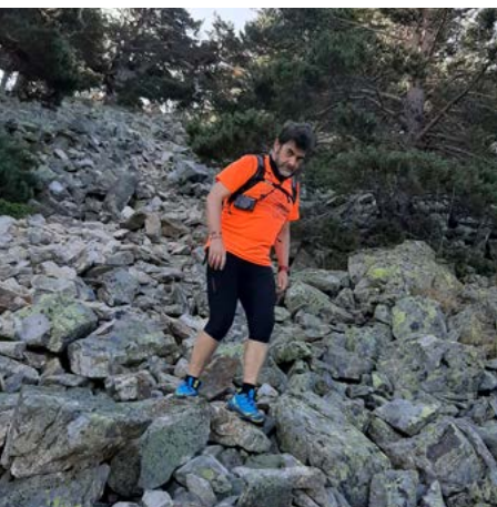
Canchal de piedras