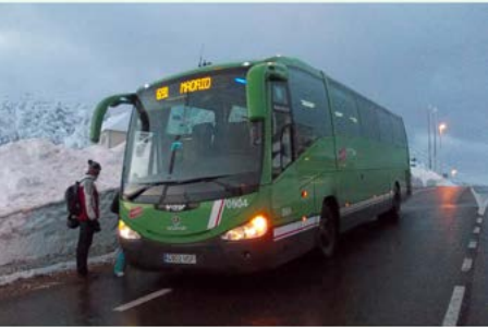
Puerto de Navacerrada

La sierra de Guadarrama alberga parajes que son verdaderos tesoros por su calidad paisajística y ambiental. Si una virtud tiene la ruta que te presentamos es la de encadenar muchos de estos parajes únicos. Baste citar la travesía cimera de los Siete Picos a la que añadimos las ascensiones al Cerro del Águila y, sobre todo, a La Peñota.