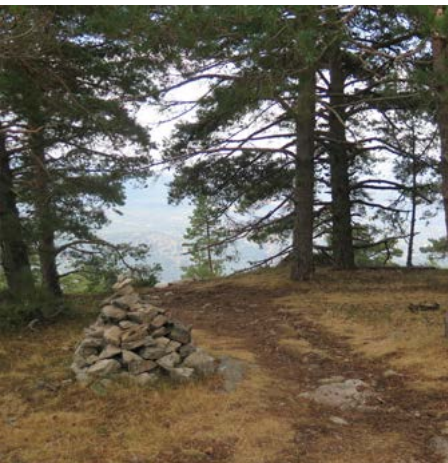
Collado Cerromalejo. Bajada a Cercedilla