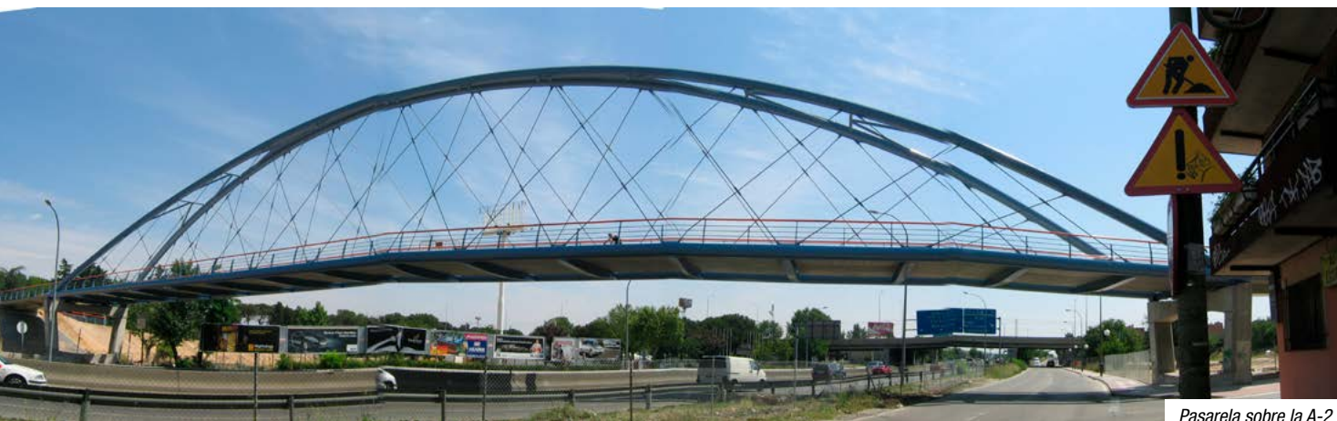
Pasarela sobre la A-2