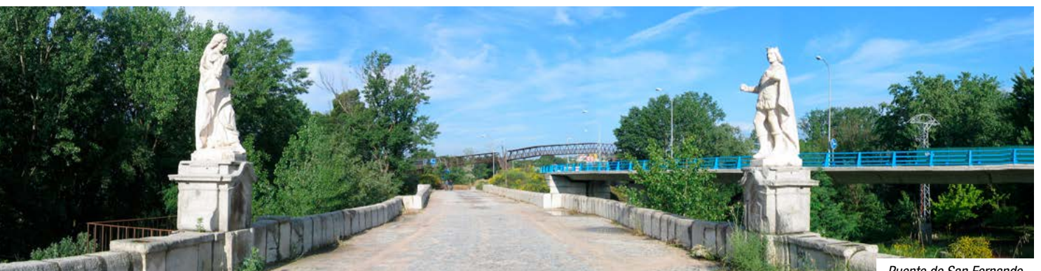
Puente de San Fernando

Paso bajo la M-30 (kilómetro 8,4). A la izquierda veremos una curiosa capilla dedicada a Santo Domingo de la Calzada y que ha sido edificada bajo el mismo puente de la M-30.