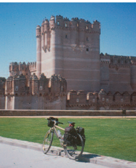
Coca es un importante punto de paso en el Camino de Madrid

Distancia. Este primer tramo, de 11,50 kilómetros, discurre por el casco urbano de Madrid pudiendo ir y regresar en Metro. Se trata de un “calentamiento” con respecto al resto de etapas que hemos de afrontar en jornadas posteriores.