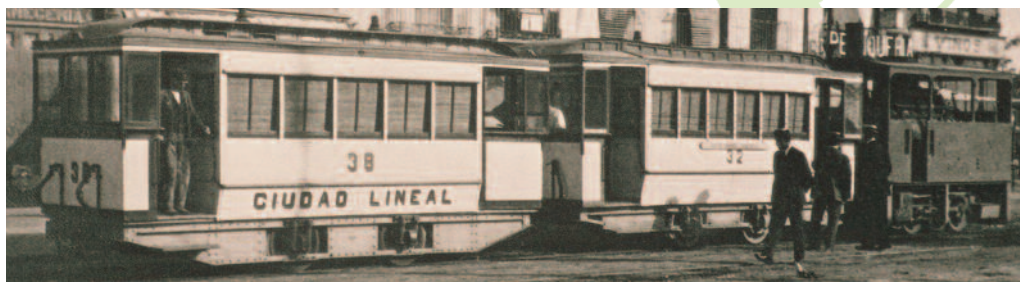
Bravo Murillo, eje histórico de comunicaciones

Los viejos caminos del norte. Seguiremos la vieja ruta que desde el centro de la ciudad, se dirigía al antiguo pueblo de Fuencarral y desde allí al norte de España. A partir de la Plaza de Castilla este itinerario era conocido como la “carretera de Francia”.