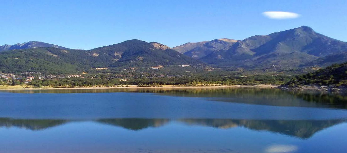
Espectacular vista del embalse de Navacerrada y el valle de La Barranca