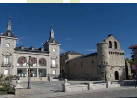
Plaza Mayor de Alpedrete