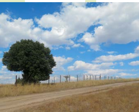
Subida a Valdeleganar

Cruce y giro a la derecha (Kilometro 10). El camino de la izquierda procede de Colmenar Viejo. Seguimos con la tapia siempre a la derecha.