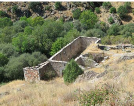
Ruinas de un Batán