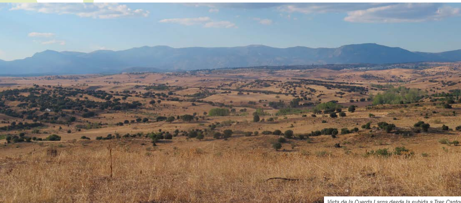
Vista de la Cuerda Larga desde la subida a Tres Cantos

Estación de Cercanías de Tres Cantos (kilómetro 20,00). Final de la ruta.