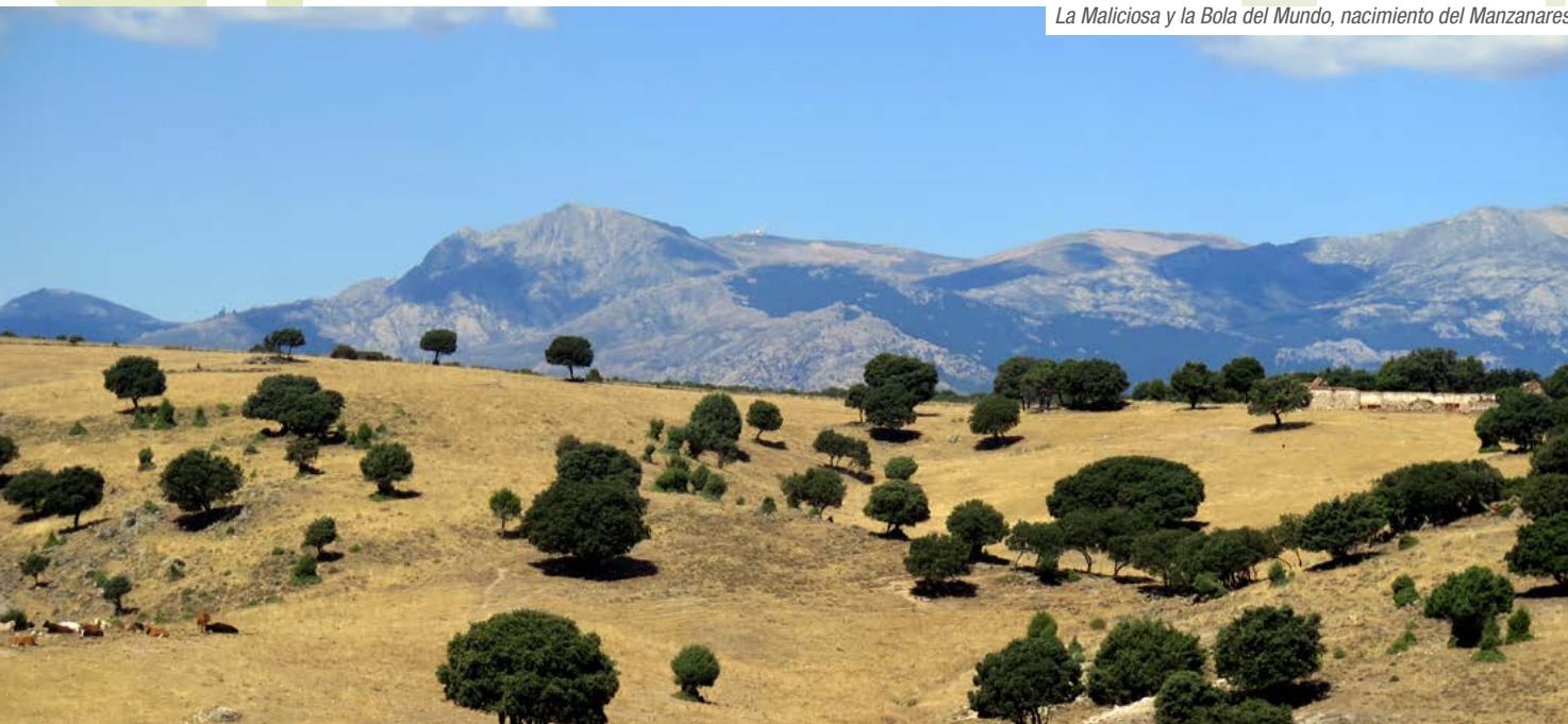
La Maliciosa y la Bola del Mundo, nacimiento del Manzanares

Casa y Portillera de la Marmota (kilómetro 10,70). Numerosas “portilleras” permiten acceder al recinto de El Pardo y en todas ellas veremos que existen casas para los guardas del recinto. Estamos junto a la cola del embalse y desde aquí no va a ser posible seguir junto al curso del Manzanares ya que este se adentra en el recinto del Monte de El Pardo. Será en Mingorrubio cuando podamos regresar junto al río. Camino y tapia giran a la izquierda y nos acompañarán en una larga y monótona subida que conduce hasta una nueva portillera.