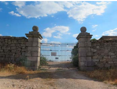
Portillera de Valdeleganar

Casa y Portillera de Valdeleganar (kilómetro 13,70). Fin de la subida en la que hemos salvado, no sin esfuerzo, algo más de 100 metros de desnivel. A nuestras espaldas podemos ver el Alto de la Marmota y un poco más lejos la Cuerda Larga y la Pedriza. Poco a poco la Sierra de Guadarrama queda atrás. La pista que accede a Valdeleganar procede del Polígono Industrial de Colmenar cuyas primeras naves vemos no demasiado lejos. Seguimos en paralelo a la tapia y descendiendo hacia el valle del arroyo de Tejada. El paisaje cambia y hacia la izquierda vemos pequeñas explotaciones agrarias..