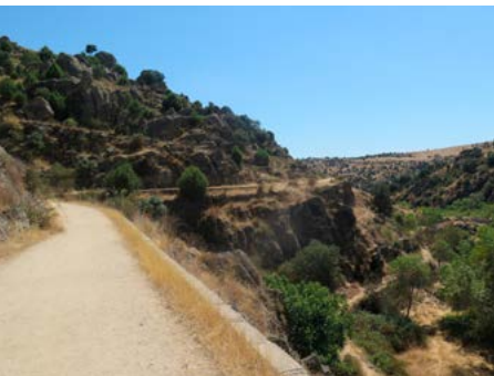
Camino del Canal