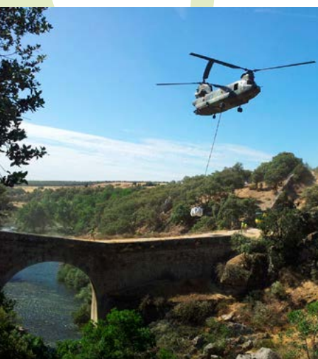
Puente de la Marmota

El Puente del Grajal. Obra de origen árabe asociada a la línea defensiva establecida por los andalusíes en la frontera con los reinos cristianos entre los siglos X y XI. Coetáneas a este puente los investigadores sitúan atalayas como la Torrecilla de Hoyo de Manzanares o la de Torreldones. El puente del Grajal está levantado en piedra de granito donde destaca su amplio arco de medio punto y su rasante alomada muy habitual en la época. Fue restaurado y parcialmente modificado en el siglo XVIII. Junto a él, se alza otro puente construido para facilitar la circulación de vehículos por la carretera M-618 que conecta Colmenar Viejo con Hoyo de Manzanares.