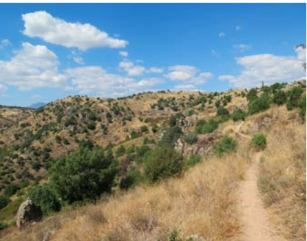
Cordel de la Huelga