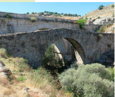
Puente del Grajal

Además de la propia ruta a pie, a lo largo de la excursión tendremos la oportunidad de conocer enclaves muy interesantes desde el punto de vista cultural, medioambiental y paisajístico.