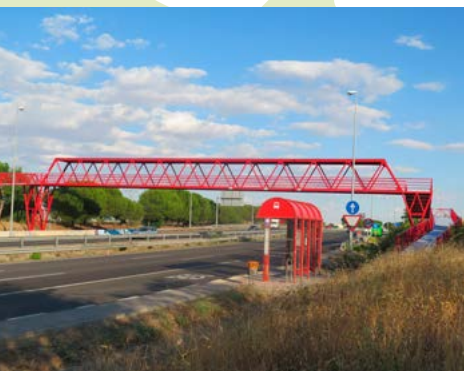
Pasarela sobre la M-607

Arroyo de Tejada (kilómetro 17,00). Un vado permite cruzar el arroyo salvo que este baje con demasiado caudal y tengamos que quitarnos el calzado para no mojarnos. Justo al otro lado del cauce giramos a la izquierda, y en pocos metros veremos que comienza una fuerte subida que va siguiendo el trazado del Cordel de Valdeloshielos. Este inesperado capítulo final en forma de dura subida está “a la altura” de otras dificultades que hemos dejado atrás a lo largo del día.