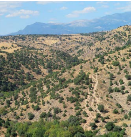
Bajada a Navarrosilla

reconocerás por tratarse de un sendero paralelo a una tapia de piedra. En esta opción has de sumar un kilómetro más al cómputo total del recorrido