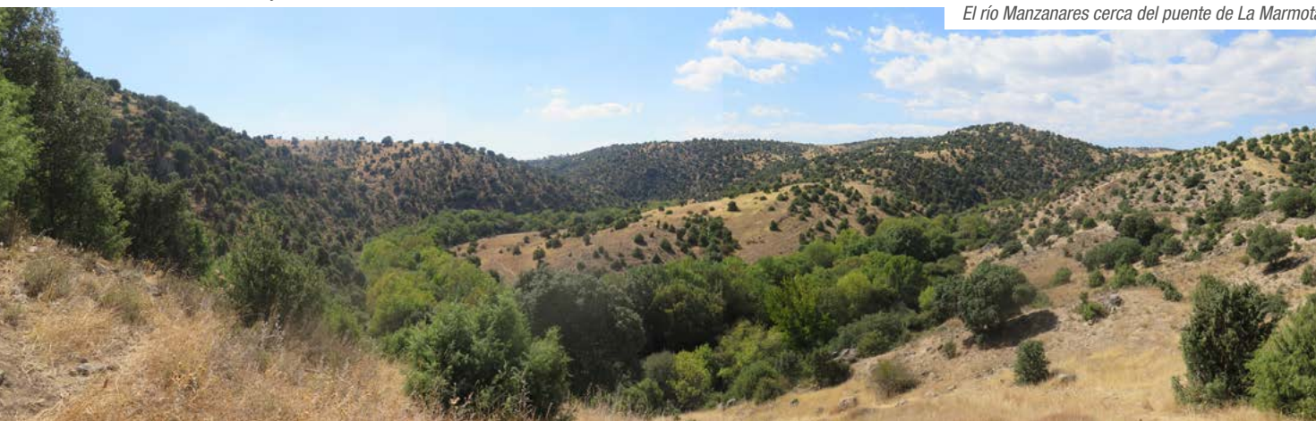
El río Manzanares cerca del puente de La Marmota

Alto de las Carrizosas (Kilómetro 6,50). Zona de la ruta despejada de vegetación y relativamente elevada lo que permite que las vistas sean magníficas. De frente va apareciendo poco a poco la silueta de Madrid con las torres de la Castellana como principal referente.