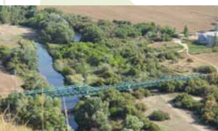
El Puente de La Poveda

Metro Rivas Vaciamadrid (kilómetro 13). Final de la ruta. Recomendamos, antes de subir regresar en la línea 9, dar un paseo y tomar un refrigerio en el coqueto casco antiguo de Rivas mientras contemplamos el elegante vuelo de las cigüeñas. Conexión Rutas Verdes: RV-2.2, RV-2.3, RV-3.1 y RV-3.2.