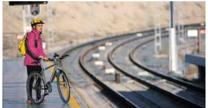
Inicio y final de la ruta