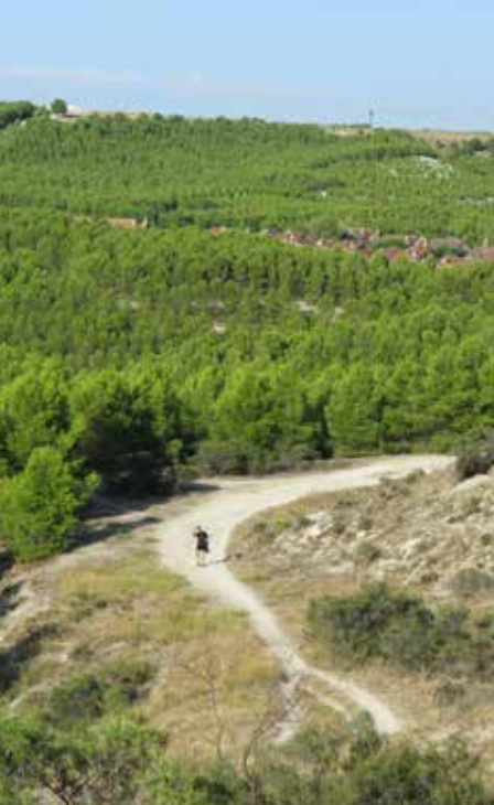
Cerro del Telégrafo

Abandonamos el Paseo de las Provincias (kilómetro 2,6). Hemos llegado a la altura de la calle Palencia. Aquí veremos una barrera a la derecha que da paso a una pista forestal. Aquí abandonamos el asfalto y comenzamos a transitar por dicha pista. Se trata de un camino ancho que discurre entre el valle del Jarama (izquierda) y las últimas casas de Rivas (derecha).