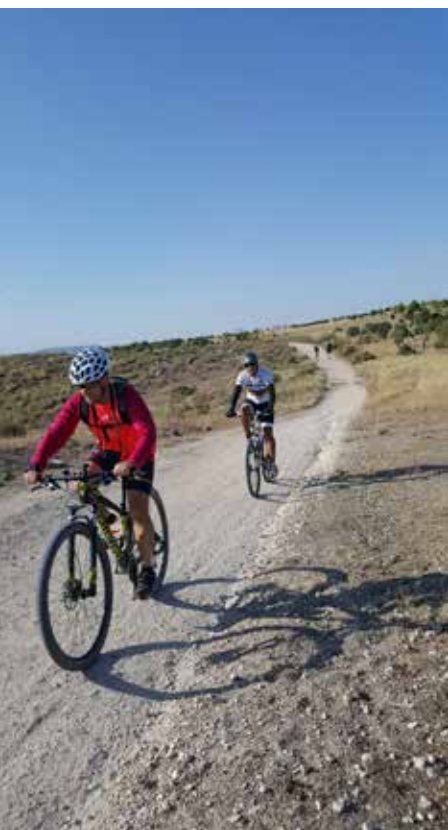
Bajando a la Laguna