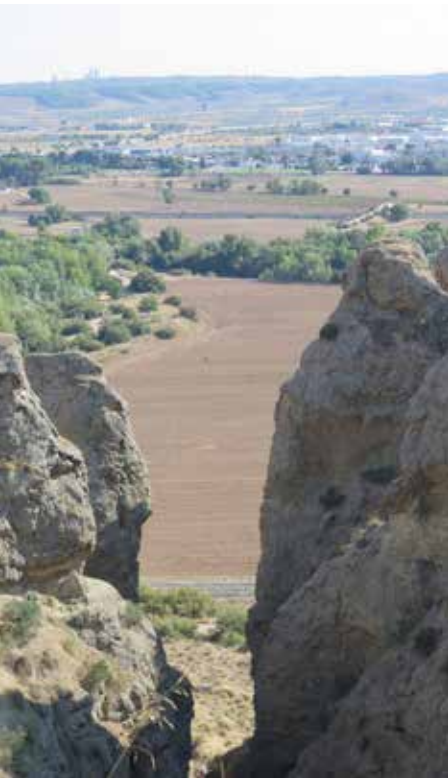
Al fondo Arganda del Rey

El cerro del Telégrafo. En la cima de este popular promontorio y a casi 700 metros de altitud se instaló en 1850 la torre número 3 de la línea de telégrafos ópticos entre Madrid-Valencia y que funcionó hasta 1855. La torre 2 en sentido a Madrid estaba en el cerro Almodóvar. Ya no quedan restos de este edificio debido a los usos posteriores de esta cima como las prácticas de vuelo sin motor. Debido a su singular morfología el Telégrafo es todo un icono de la ciudad.