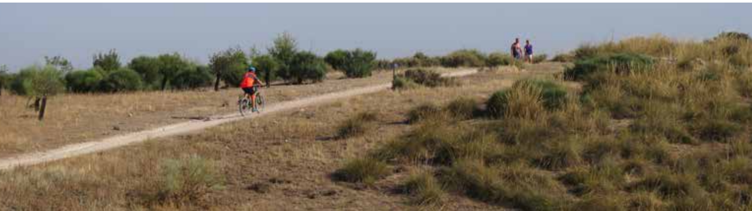
Camino para ciclistas y caminantes