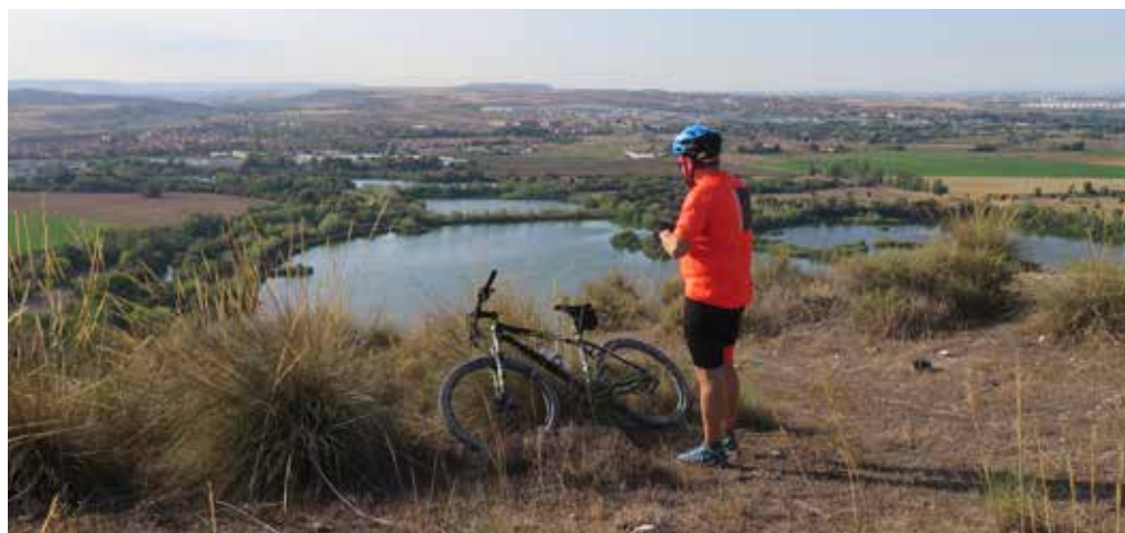
Lagunas de Velilla

Cruce de pistas (kilómetro 3,9). Seguiremos siempre las opciones que siguen recto o a la izquierda, de otra manera entraríamos de nuevo en el casco urbano de la ciudad. Como norma general nunca tomaremos ningún camino que baje de manera notoria ladera abajo (izquierda).