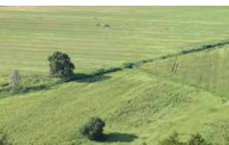
Finca El Piul

Cruce de pistas (kilómetro 3,9). Seguiremos siempre las opciones que siguen recto o a la izquierda, de otra manera entraríamos de nuevo en el casco urbano de la ciudad. Como norma general nunca tomaremos ningún camino que baje de manera notoria ladera abajo (izquierda).