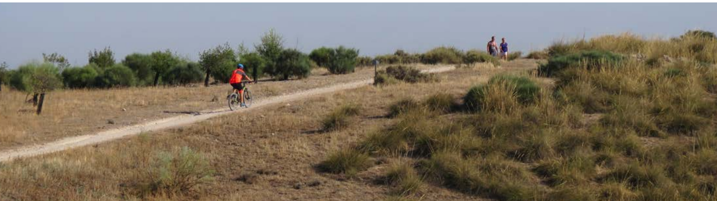
Camino para ciclistas y caminantes