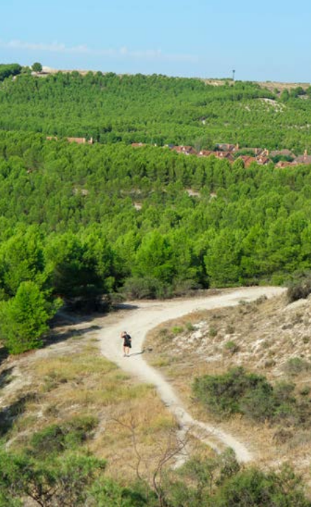
Cerro del Telégrafo

Abandonamos el Paseo de las Provincias (kilómetro 2,6). Hemos llegado a la altura de la calle Palencia. Aquí veremos una barrera a la derecha que da paso a una pista forestal. Aquí abandonamos el asfalto y comenzamos a transitar por dicha pista. Se trata de un camino ancho que discurre entre el valle del Jarama (izquierda) y las últimas casas de Rivas (derecha).