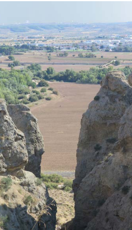
Al fondo Arganda del Rey

El cerro del Telégrafo. En la cima de este popular promontorio y a casi 700 metros de altitud se instaló en 1850 la torre número 3 de la línea de telégrafos ópticos entre Madrid-Valencia y que funcionó hasta 1855. La torre 2 en sentido a Madrid estaba en el cerro Almodóvar. Ya no quedan restos de este edificio debido a los usos posteriores de esta cima como las prácticas de vuelo sin motor. Debido a su singular morfología el Telégrafo es todo un icono de la ciudad.