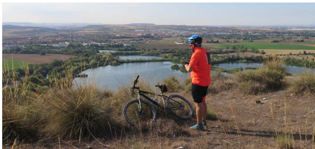
Lagunas de Velilla

Cruce de pistas (kilómetro 3,9). Seguiremos siempre las opciones que siguen recto o a la izquierda, de otra manera entraríamos de nuevo en el casco urbano de la ciudad. Como norma general nunca tomaremos ningún camino que baje de manera notoria ladera abajo (izquierda).