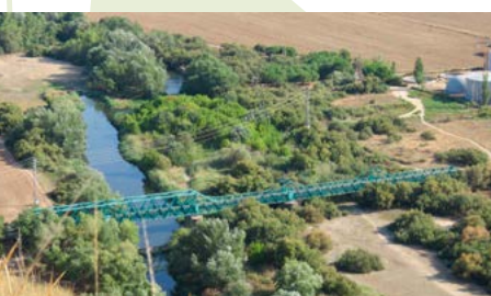
El Puente de La Poveda

Bajada a la carretera (kilómetro 11). Un progresivo descenso que afrontamos con cautela debido a la pendiente y a las piedras sueltas nos deja en la carretera que va desde Rivas a la Laguna del Campillo. Giramos a la derecha para finalizar la ruta. Precaución, de nuevo, con los automóviles.