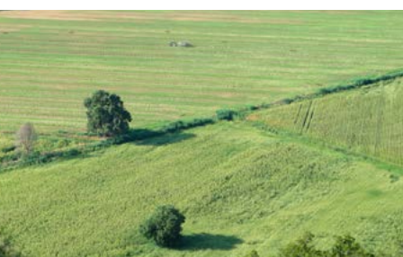
Finca El Piul

Cruce de pistas (kilómetro 3,9). Seguiremos siempre las opciones que siguen recto o a la izquierda, de otra manera entraríamos de nuevo en el casco urbano de la ciudad. Como norma general nunca tomaremos ningún camino que baje de manera notoria ladera abajo (izquierda).