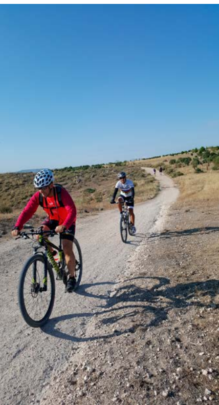
Bajando a la Laguna