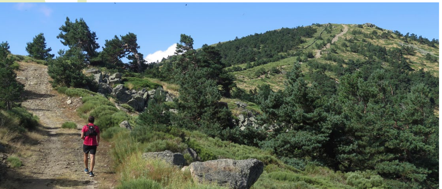
Subiendo desde Marichiva a la Peña del Águila

Los Siete Picos. Su perfil aserrado es, sin duda, una de las imágenes más simbólicas de la sierra de Guadarrama. El pico más elevado del conjunto y el más oriental es conocido como pico de Somontano en reconocimiento a Albino de Somontano, un pionero del montañismo madrileño. En él se sitúa el vértice geodésico (2.121 m). El séptimo pico, el más occidental, se encuentra separado del resto y es conocido como pico de Majalasca. En época medieval la Sierra de Guadarrama era conocida como “La Sierra del Dragón” ya que el perfil dentado de Siete Picos recordaba al lomo aserrado de este ser mitológico.