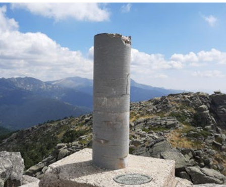
Vértice geodésico de La Peñota

La Peñota. Estamos ante otra de las montañas icónicas del Guadarrama. En realidad se trata de un conjunto de tres cimas situándose en una de ellas el vértice geodésico (1.945 m). La Peñota es un espectacular mirador de la Sierra, sobre todo si miramos hacia el sur donde se extiende la llanura a más de 800 metros por debajo de la cumbre. Este pico, que forma parte del límite administrativo entre Madrid y Segovia, es un importante hito del sendero de gran recorrido GR-10 que nos conduce desde aquí al Alto del León y San Lorenzo de El Escorial.