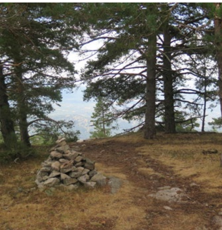
Collado Cerromalejo. Bajada a Cercedilla