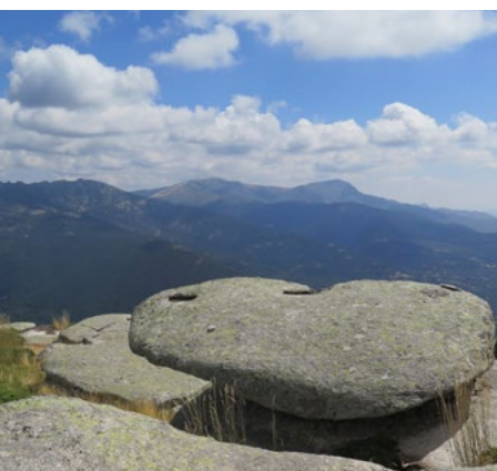
Bola y la Maliciosa desde La Peñota