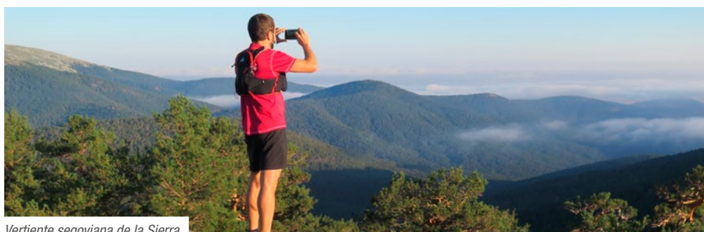
Vertiente segoviana de la Sierra