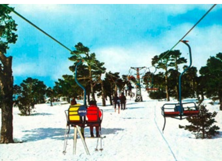
El Telégrafo. Postal de 1970

Puerto de Navacerrada (kilómetro 0). Altitud 1.860 m. En la parte posterior de la Venta Arias se encuentra el recinto vallado del telesilla del Telégrafo. Lo bordeamos hacia el lado izquierdo para subir por un empinado camino que siempre tendrá la valla del telesilla a la derecha. La subida finaliza en el llamado “cerro del Telégrafo” donde finaliza también el telesilla.