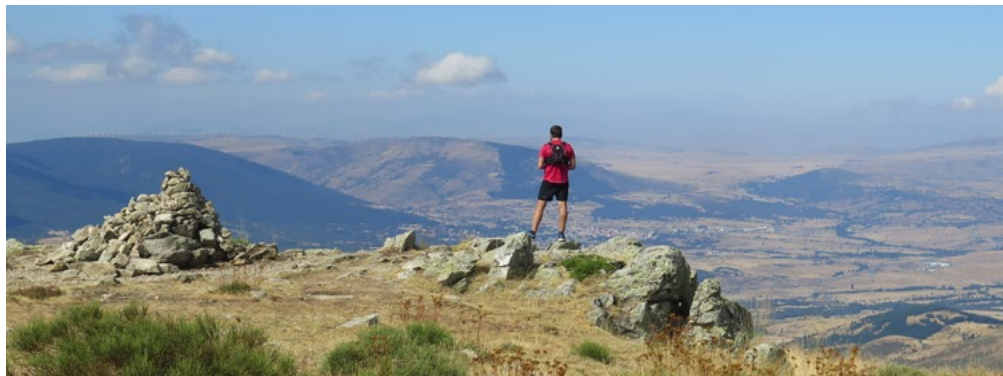
Peña de El Águila. Al fondo El Espinar.