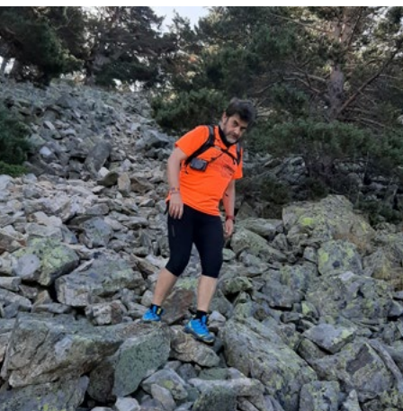
Canchal de piedras