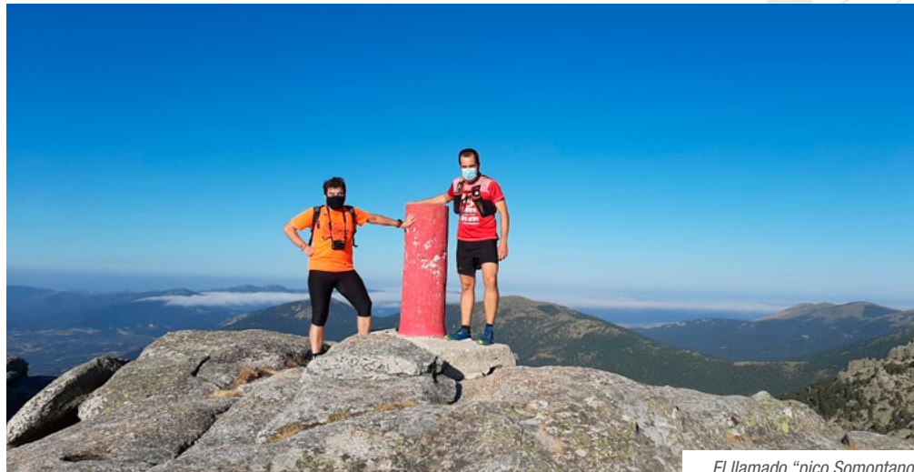
El llamado "pico Somontano"