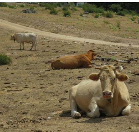
Pradera de los Campamentos