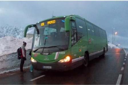
Puerto de Navacerrada

La sierra de Guadarrama alberga parajes que son verdaderos tesoros por su calidad paisajística y ambiental. Si una virtud tiene la ruta que te presentamos es la de encadenar muchos de estos parajes únicos. Baste citar la travesía cimera de los Siete Picos a la que añadimos las ascensiones al Cerro del Águila y, sobre todo, a La Peñota.