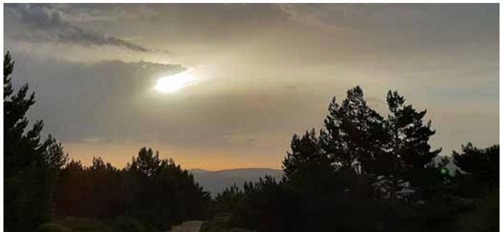
Subida a Dos Hermanas

Pico Dos Hermanas (kilómetro 4,0). Después de una interminable subida alcanzamos esta alomada cima de 2.284 metros de altitud. Desde aquí las vistas son impresionantes gracias al importante desnivel que hemos ganado. A partir de ahora el camino se hace muy cómodo al transitar por el suave cordal que separa Madrid de Segovia y que va ganando altura hasta llegar a Peñalara. Los cercos de piedra y las depresiones lineales excavadas en el suelo son fortificaciones y trincheras de la Guerra Civil que tuvo en tan inhóspito lugar uno de sus frentes de combate.