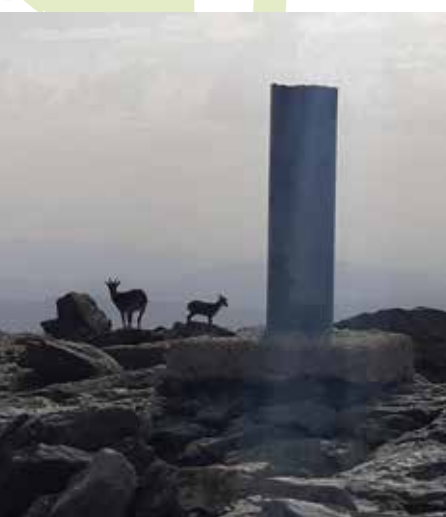
Cabras Montesas. Pico Peñalara

El Puerto de Cotos o del Paular. Se trata de un histórico paso de montaña que a lo largo de los siglos comunicó el valle de Valsaín donde se encuentra el palacio de La Granja y el valle del Lozoya (El Paular). La conexión a Navacerrada por carretera y ferrocarril es, sin embargo, mucho más moderna. El topónimo “Cotos” alude a la presencia de unos mojones de piedra, denominados de esa manera ya que marcaban cada cierto tiempo el trazado del camino para hacerlo visible durante la época de nevadas. En el puerto, a 1.830 metros de altitud, encontraremos la estación de ferrocarril, el chalet del Club Alpino Español, la histórica Venta Marcelino y un centro de información del Parque Nacional de Guadarrama.