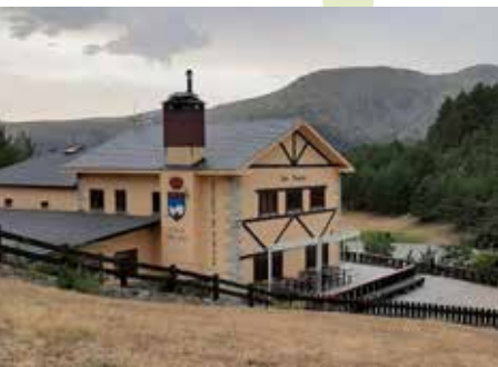
Venta Marcelino. Cotos

Puerto de Cotos (kilómetro 0). Para comenzar la ruta subiremos hacia el centro de visitantes del Parque Nacional por el ancho camino que parte junto a la marquesina del Consorcio de Transportes. Rebasamos una caseta de vigilancia en el lado derecho y entramos en una pista de tierra jalonada por pinos silvestres.