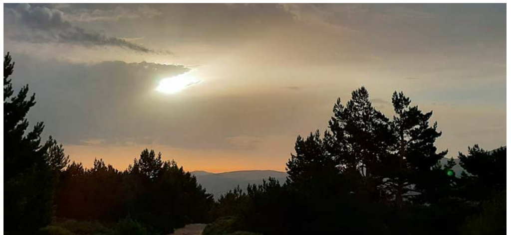
Subida a Dos Hermanas

Pico Dos Hermanas (kilómetro 4,0). Después de una interminable subida alcanzamos esta alomada cima de 2.284 metros de altitud. Desde aquí las vistas son impresionantes gracias al importante desnivel que hemos ganado. A partir de ahora el camino se hace muy cómodo al transitar por el suave cordal que separa Madrid de Segovia y que va ganando altura hasta llegar a Peñalara. Los cercos de piedra y las depresiones lineales excavadas en el suelo son fortificaciones y trincheras de la Guerra Civil que tuvo en tan inhóspito lugar uno de sus frentes de combate.