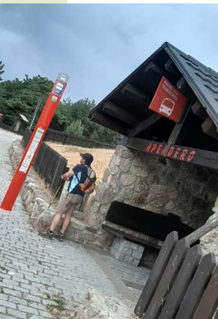
Parada de la línea 691. Puerto de Cotos

Además de la propia ruta a pie, a lo largo de la excursión tendremos la oportunidad de conocer enclaves muy interesantes desde el punto de vista medioambiental y paisajístico.