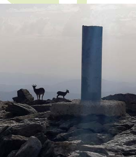
Cabras Montesas. Pico Peñalara

El Puerto de Cotos o del Paular. Se trata de un histórico paso de montaña que a lo largo de los siglos comunicó el valle de Valsaín donde se encuentra el palacio de La Granja y el valle del Lozoya (El Paular). La conexión a Navacerrada por carretera y ferrocarril es, sin embargo, mucho más moderna. El topónimo “Cotos” alude a la presencia de unos mojones de piedra, denominados de esa manera ya que marcaban cada cierto tiempo el trazado del camino para hacerlo visible durante la época de nevadas. En el puerto, a 1.830 metros de altitud, encontraremos la estación de ferrocarril, el chalet del Club Alpino Español, la histórica Venta Marcelino y un centro de información del Parque Nacional de Guadarrama.