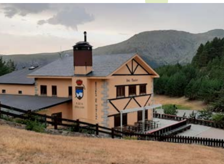
Venta Marcelino. Cotos

Puerto de Cotos (kilómetro 0). Para comenzar la ruta subiremos hacia el centro de visitantes del Parque Nacional por el ancho camino que parte junto a la marquesina del Consorcio de Transportes. Rebasamos una caseta de vigilancia en el lado derecho y entramos en una pista de tierra jalonada por pinos silvestres.