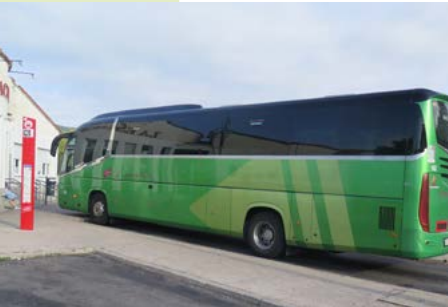
Estación de Autobuses Moralarzal

Te vamos a invitar a realizar una ruta con un encanto especial ya que nos va a permitir disfrutar de unas vistas privilegiadas de la Sierra y a la vez va a suponer un aprendizaje sobre la historia de las telecomunicaciones y de cómo era el mundo antes de la llegada del teléfono. Coge tu mochila, llena tu cantimplora y sube con nosotros a Cabeza Mediana.