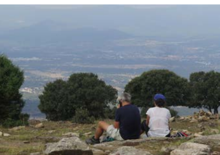
Cima Cabeza Mediana