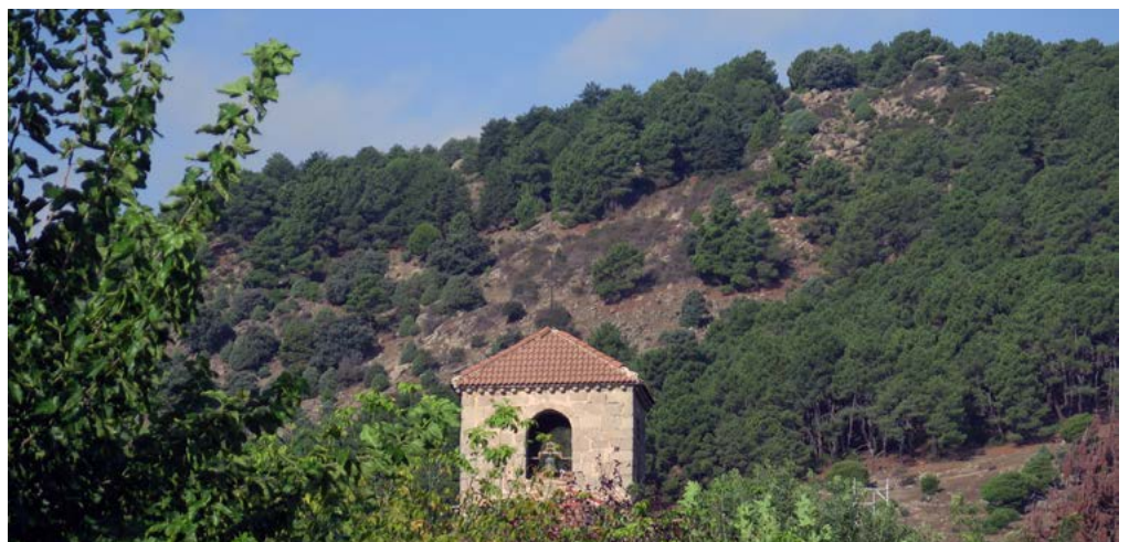
Laderas de Cabeza Mediana

La torre del telégrafo óptico. Esta edificación singular, también conocida como Monterredondo, se encuentra ubicada a 1.331 metros de altura en la cima de Cabeza Mediana. Su construcción se remonta a 1830 cuando se proyectó y puso en marcha la red de telégrafo óptico desde el Palacio Real a los palacios