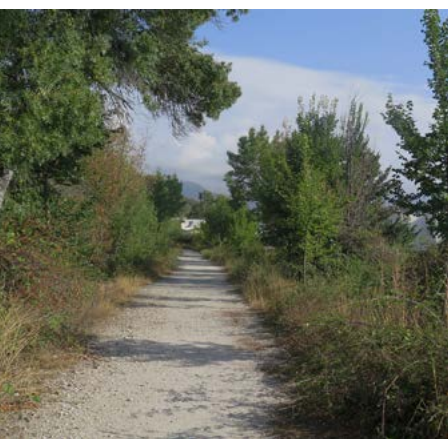
Comienzo de la pista

Paraje de la Cercas del Rubio (kilómetro 1,8). Cruce y giro a la izquierda, atravesamos una barrera y abandonamos definitivamente Moralarzal. Comienza la subida a Cabeza Mediana siguiendo siempre la pista principal muy transitada por caminantes y ciclistas.