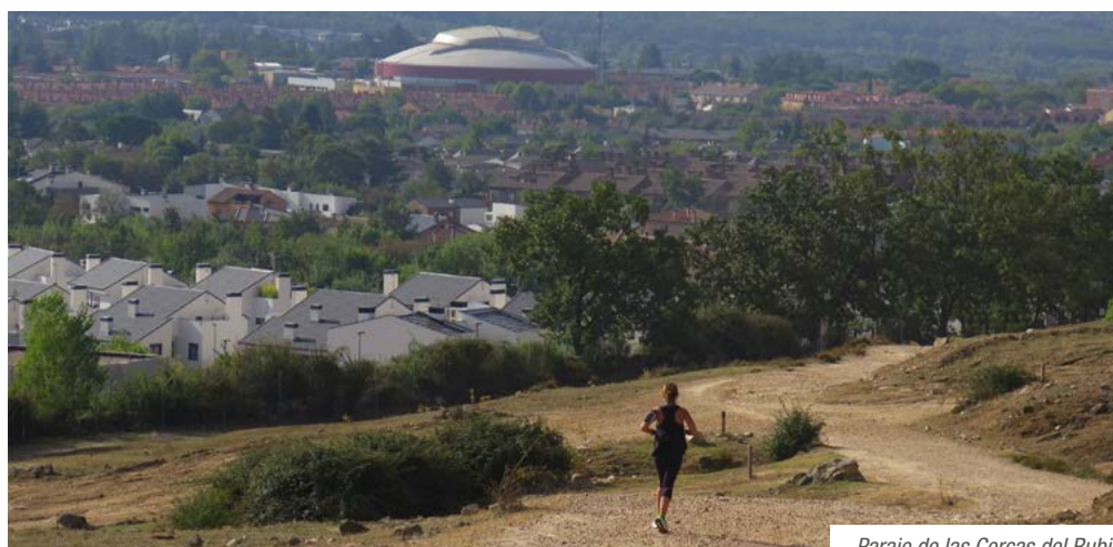
Paraje de las Cercas del Rubio