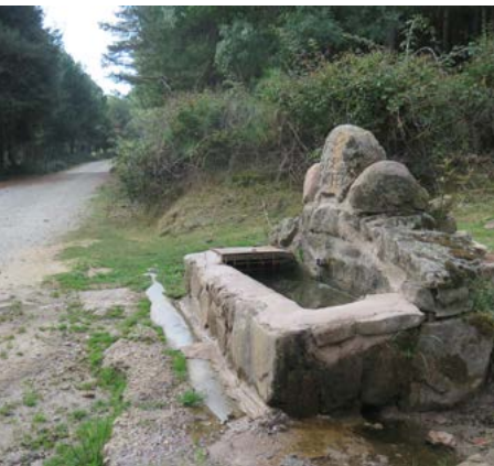
Fuente del Vivero