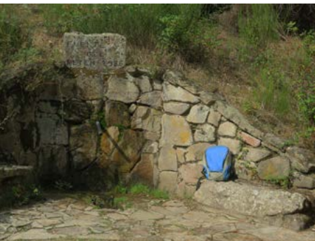
Fuente del Retén