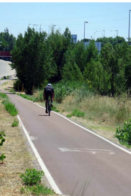
Zona de la Ciudad Escolar

Universidad Autónoma de Madrid (kilómetro 5,0). Diversas Facultades y escuelas de la UAM van quedando a la derecha del carril. En este punto se encuentra el acceso a la estación de Cercanías de Cantoblanco.