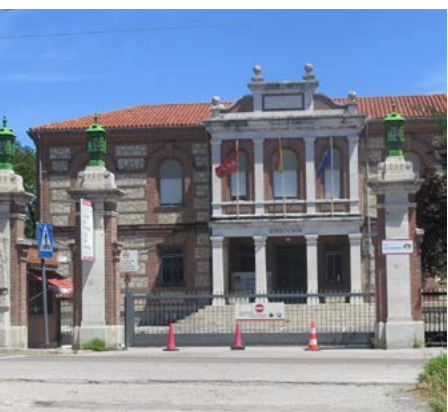
Colegio San Fernando

Estación de Fuencarral (kilómetro 0). Salimos por el único acceso que tiene la estación y en apenas 300 metros accedemos al semáforo de la Av. de Nuestra Señora de Valverde. Giramos a la derecha y seguimos por esta avenida en sentido norte.