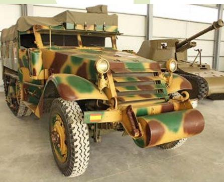
Vehículo del Museo

La Ciudad Escolar San Fernando. El núcleo histórico de este importante complejo educativo tiene sus orígenes en el año 1926 cuando el Ayuntamiento de Fuencarral cede gratuitamente unos terrenos en el Monte de Valdelatas para levantar un colegio. Las instalaciones, modélicas para su época, son edificadas en estilo castellano, con ladrillo visto y cajones de mampostería. A este centro se une en 1968 la Ciudad Escolar Provincial. Ambos complejos son un referente educativo en la Comunidad de Madrid.