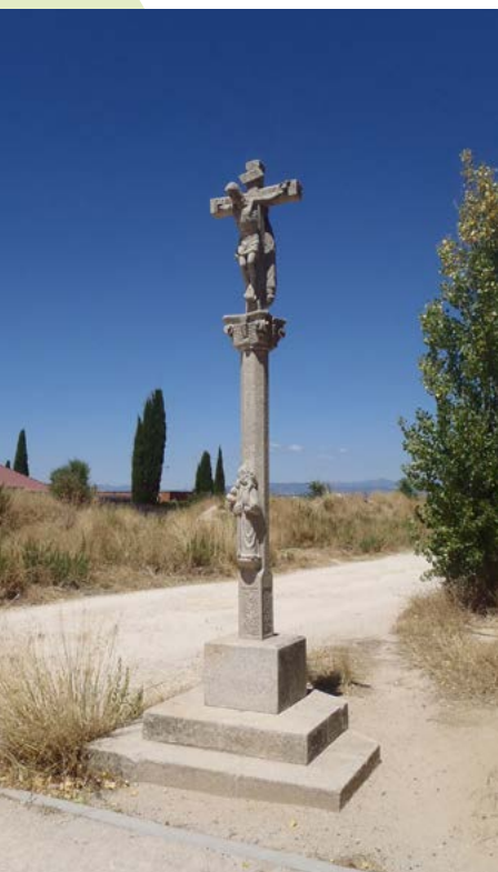
Crucero del Camino de Santiago

Carril bici de la carretera de Colmenar (kilómetro 2,3). En este punto conectamos con el ramal que viene desde la estación de Cercanías de Fuencarral. Giramos a la izquierda y nos encaminamos a Colmenar y Soto.