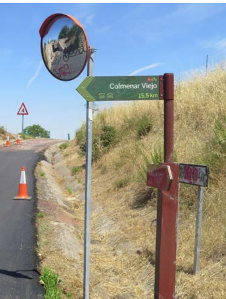
Desvío hacia Alcobendas