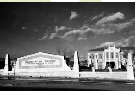
Colegio San Fernando

Además de la propia ruta en bicicleta, a lo largo de la excursión tendremos la oportunidad de conocer enclaves muy interesantes desde el punto de vista urbanístico, medioambiental y paisajístico.