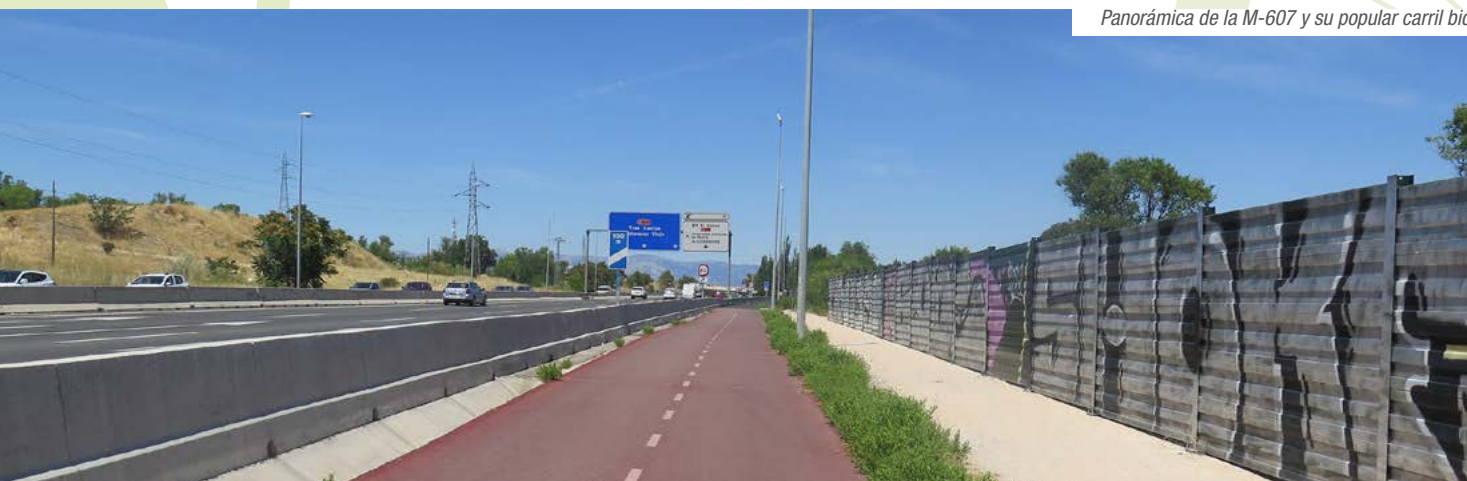
Panorámica de la M-607 y su popular carril bici