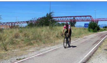
Cruce de El Goloso