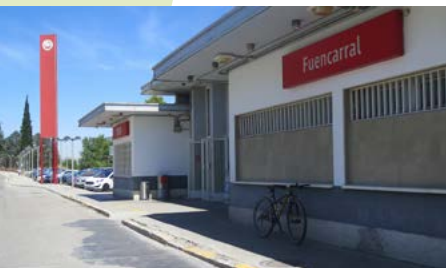
Estación de Cercanías de Fuencarral

Utilizaremos como punto de partida la estación de Cercanías de Fuencarral. También se puede comenzar desde el metro de Montecarmelo en la línea 10. Si vienes desde Alcobendas por el carril bici de la M-616 puedes iniciar la ruta en la estación de Cercanías de Valdeasfuentes. Una vez que se llega a Soto del Real se regresa en bicicleta a Madrid aunque hay varias opciones para volver en transporte público acortando el kilometraje como utilizar las estaciones de Cercanías de Colmenar Viejo, Tres Cantos o El Goloso.