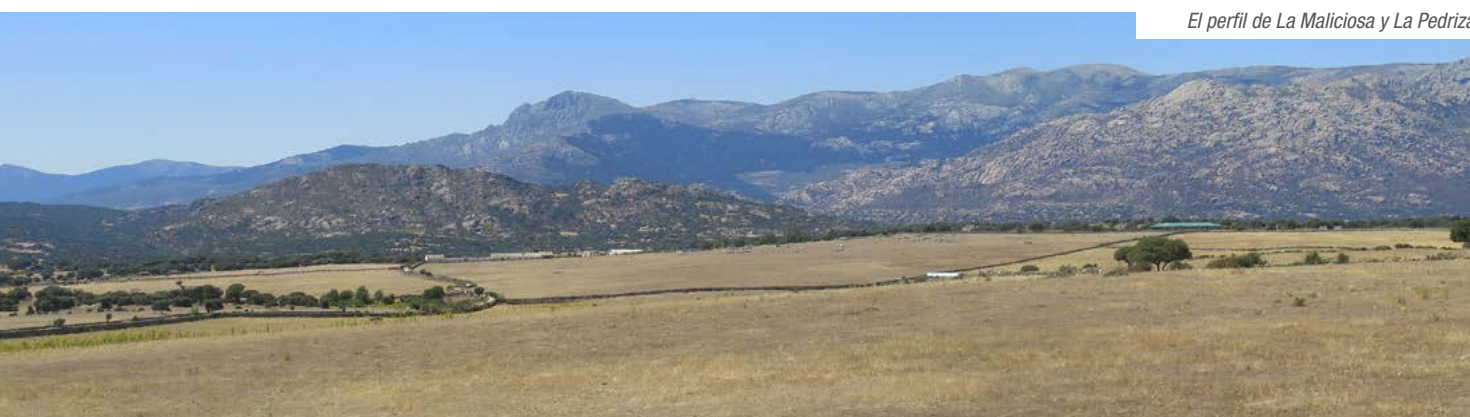
El perfil de La Maliciosa y La Pedriza

Desvío a Soto (kilómetro 25,5). El carril bici hace un acusado giro, pasa sobre la M-607 y se coloca en paralelo a la carretera de Soto (M-609). A la izquierda sobre el horizonte disfrutamos del hipnótico perfil de la Maliciosa y la Pedriza. A la derecha se levanta el centro penitenciario de Soto.