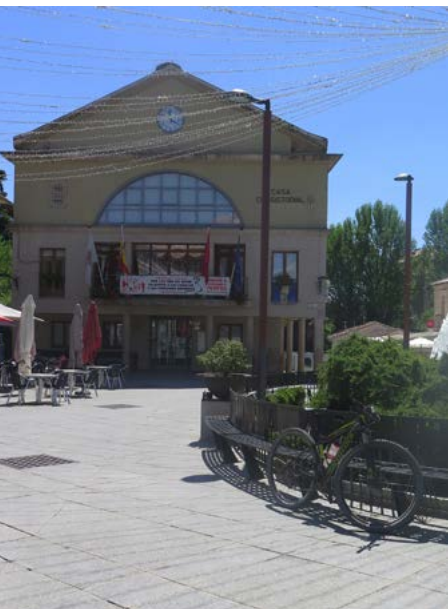
Ayuntamiento de Soto del Real