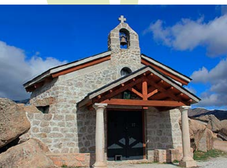
Ermita Nuestra Señora del Rosario

https://ejercito.defensa.gob.es/unidades/Madrid/muma/