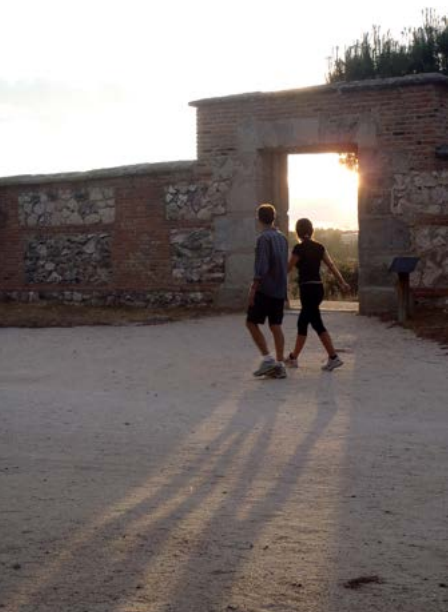
Portillo de los Pinos