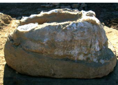
Fósil de tortuga gigante hallado en Somosaguas

Aula de Educación Ambiental de Pozuelo. El Aula ofrece una amplia variedad de actividades vinculadas a la sostenibilidad, el compromiso ciudadano y el medio ambiente. Creada en 1994 dispone de un terreno de dos hectáreas y esta abierta a todo tipo de público como lugar de reflexión y de sensibilización con el planeta. Uno de los proyectos más curiosos es el “hospital de plantas”, un espacio donde se cuidan aquellas plantas que están en mal estado. Además el Centro de Recursos de Educación Ambiental para la Sostenibilidad (CREAS), gestiona gran cantidad de proyectos del Aula. Este edificio, fabricado con los principios de construcción sostenible, gestiona el agua, la energía y sus residuos de manera autosuficiente. Junto al recinto del Aula se encuentra el Parque Forestal de Somosaguas con 150 hectáreas de extensión, prolongación natural y complemento al vecino parque de la Casa de Campo. Para saber mas www.movilizared.es