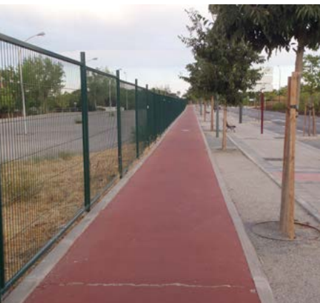
Carril bici Somosaguas

Estación de Campus de Somosaguas. (Kilómetro 0) Desde los andenes salimos a la carretera que viene de Pozuelo y sigue a Húmera. Esta carretera pasa sobre las vías del Metro Ligerero y dispone de un buen carril bici que va bordeando el perímetro del Campus de la Universidad en gradual descenso.