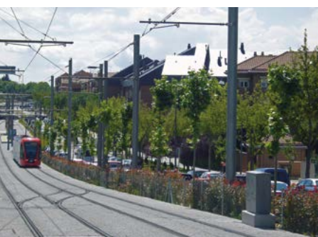
Nuevos barrios de Pozuelo