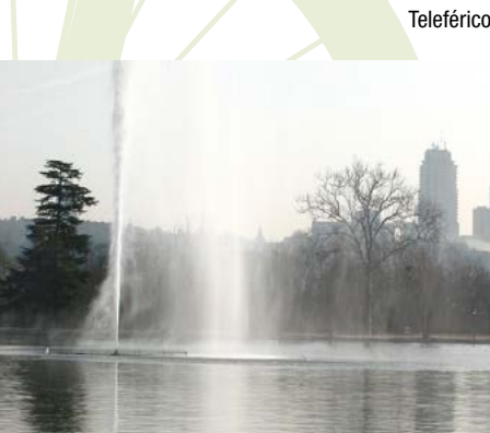
Lago de la Casa de Campo

Antiguo Cementerio de Húmera y Parque Forestal de Somosaguas (Kilómetro 2,3). Para hacer mas ágil la visita proponemos seguir la carretera asfaltada que rodea en su totalidad el Parque. Este viario tiene tres kilómetros y recomendamos seguirlo en sentido contrario a las agujas del reloj. En primer lugar pasaremos por los dos estanques, el puente sobre el arroyo de Antequina y casi al final tras un repecho, el fantástico mirador sobre la Casa de Campo y los edificios de Madrid.