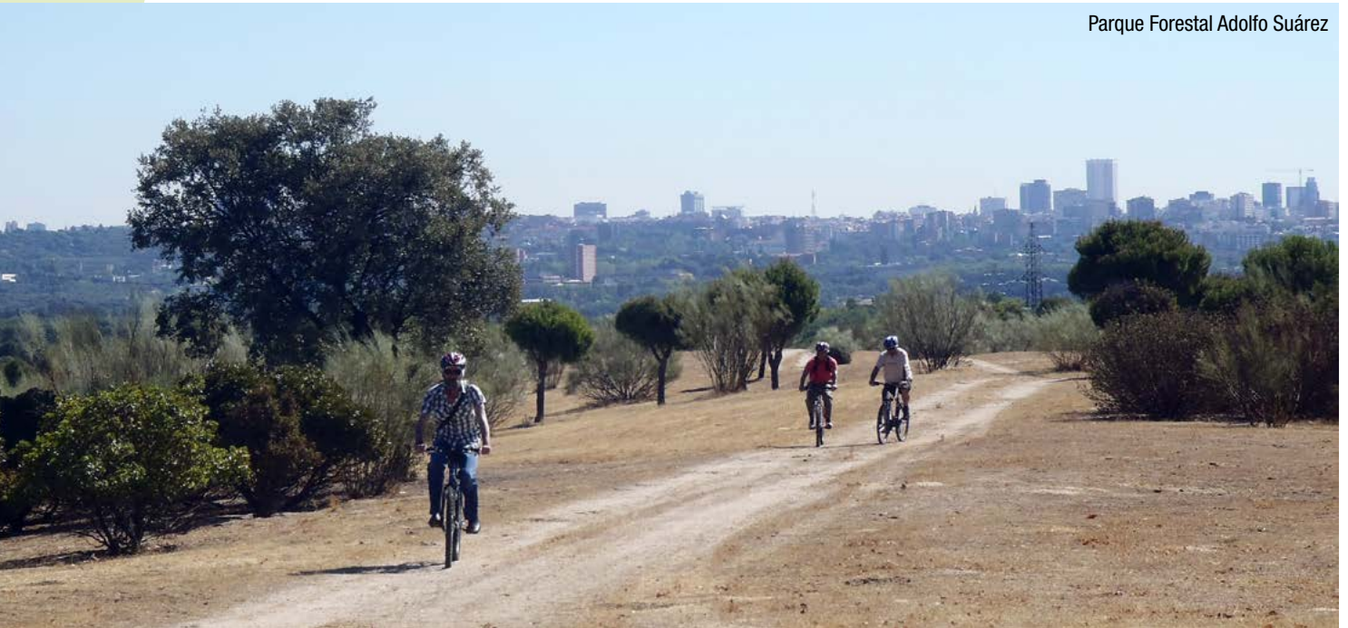
Parque Forestal Adolfo Suárez

El Metro Ligero es una realidad en la Comunidad de Madrid desde el año 2007. Un nuevo modo de transporte sostenible, accesible y que nos acerca cómodamente a nuevos parajes de la geografía de nuestra región. Dos líneas de Metro Ligero atraviesan parte de la zona oeste de Madrid y una de ellas, la ML2 nos conduce a una estación de marcado carácter universitario como es Campus de Somosaguas. Además de la Universidad, la parada está muy próxima a una pequeña joya medioambiental: El Parque Forestal de Somosaguas, una zona verde donde se puede acudir con toda la familia a participar de sus interesantes actividades y a dar un tranquilo paseo caminando o en bicicleta.