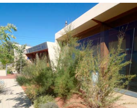
Aula de Educación Ambiental

Cruce de la M-508. (Kilómetro 1,2) Después de una larga bajada finaliza el carril bici. Cruzamos el paso de peatones junto a la rotonda de la M-508 (precaución con los coches) y entramos en las calles de Húmera hasta llegar a su tranquila plaza, recientemente bautizada con el nombre de Luis García Berlanga, director de cine fallecido y vecino de la zona. Seguimos por la calle del Cementerio hasta llegar al Aula de Medio Ambiente. Desde el Aula hasta la entrada al Parque hay unos 450 metros.