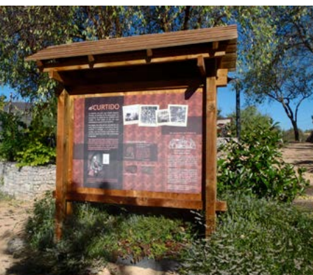
Curtido de piel. Historia de Pozuelo