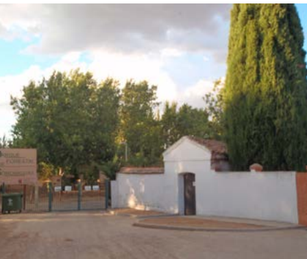
Antiguo cementerio de Húmera