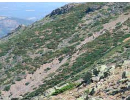
Los tubos de Cabezas