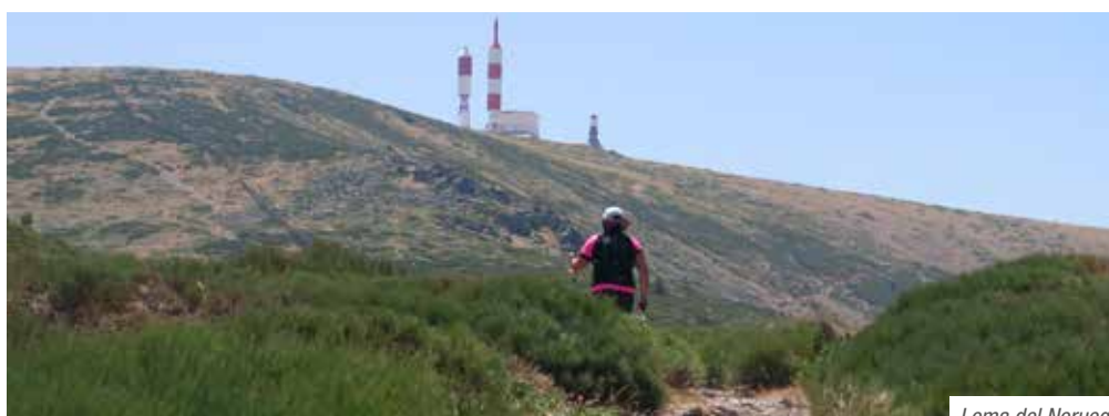
Loma del Noruego