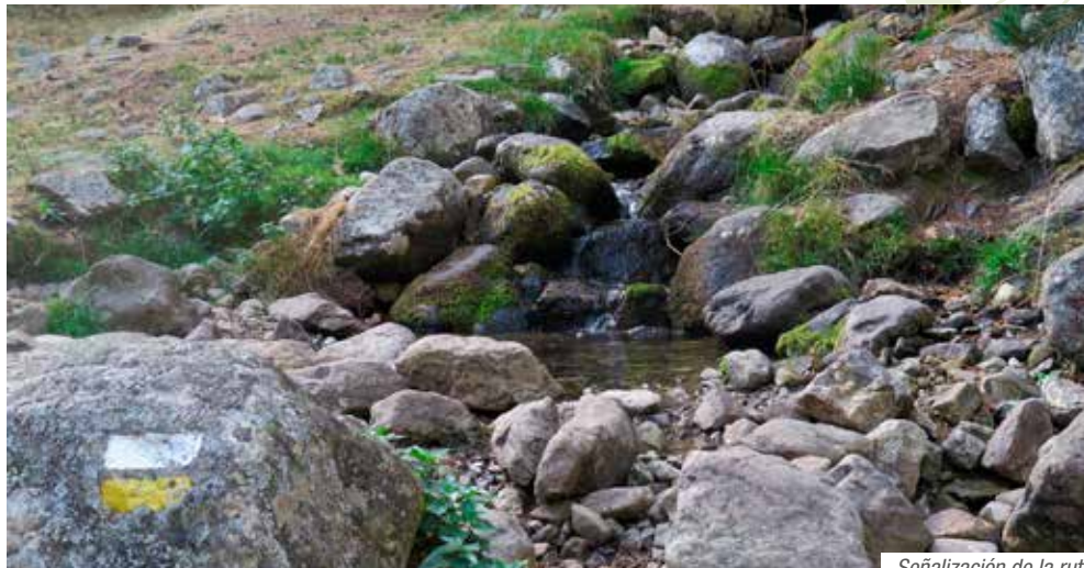
Señalización de la ruta

Arroyo de las Cerradillas (kilómetro 3,0). En realidad hay hasta tres regatos que debemos de atravesar en una zona de canchales y de gran humedad, hasta el punto de que veremos algún acebo y helechos. A partir de ahora es muy recomendable no perder nunca de vista la señalización configurada por los habituales montoncitos de piedra y las marcas blancas y amarillas que nos indican por donde va el camino. Cruzamos el último regato que conforma la cabecera del arroyo de las Cerradillas y sin solución de continuidad encaramos la dura subida directa siguiendo por una canal o “tubo” de piedra suelta. Insistimos en la importancia de tener siempre como referencia las señales de piedra aunque la subida por el tubo en realidad no tiene mayor complicación ya que el camino asciende siempre recto.