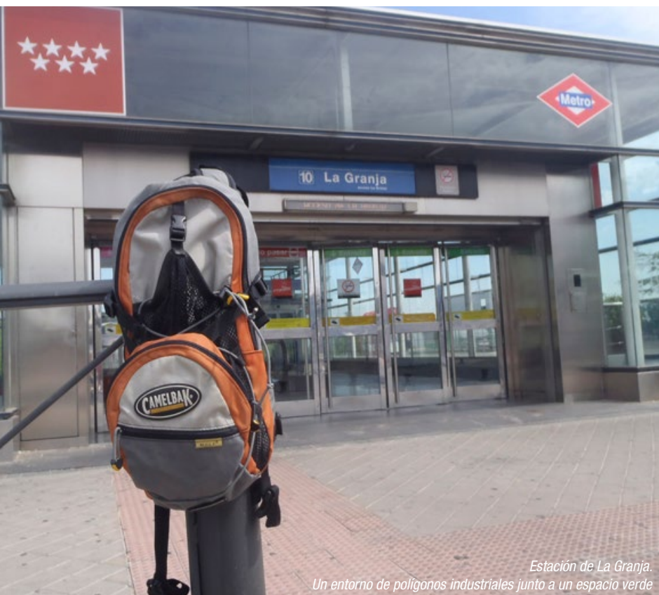
Estación de La Granja. Un entorno de polígonos industriales junto a un espacio verde

Desde el CRTM se fomenta el uso de la red de transporte público en las estaciones o paradas de autobús ubicadas en determinadas zonas de baja demanda en fin de semana: polígonos industriales o áreas empresariales que sin embargo tienen ubicaciones muy cercanas a interesantes zonas verdes como en el caso de la estación de metro de La Granja (Alcobendas), situada a escasos 400 metros del monte de Valdelatas, entre Madrid y Alcobendas.