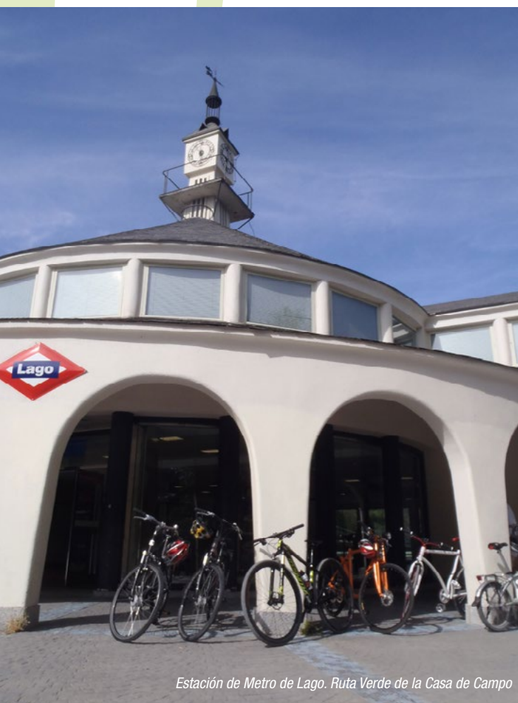
Estación de Metro de Lago. Ruta Verde de la Casa de Campo

Numerosas estaciones y paradas de autobús de la red de transporte público de la Comunidad de Madrid están ubicadas en las proximidades de algunos de estos espacios naturales y pueden ser el punto de partida para disfrutar de una jornada de ocio activo. El Consorcio Regional de Transportes (CRTM) creó en 2011 las llamadas "Rutas Verdes" en puntos de la red de transporte donde se pueden comenzar rutas de diversos niveles de dificultad aunque en realidad la mayoría son aptas para todos los públicos y que ponen en valor rincones y facetas desconocidas de la región.