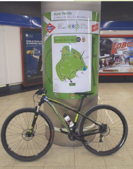
Cartel señalizador de ruta en una estación de metro

Cada estación de acceso a Ruta Verde dispone de una serie de elementos informativos que permiten conocer un poco más su entorno y las posibles rutas a realizar desde la misma, así como un cartel descriptivo en la propia estación donde figura el itinerario a realizar. Como se trata de recorridos por espacios urbanos o por parques bien señalizados son muy sencillos de seguir y no requieren de señalización específica a lo largo de la ruta. Para ponerse a pedalear o caminar bastará con tener el “Libro de Ruta” y el itinerario descargado en un dispositivo móvil.