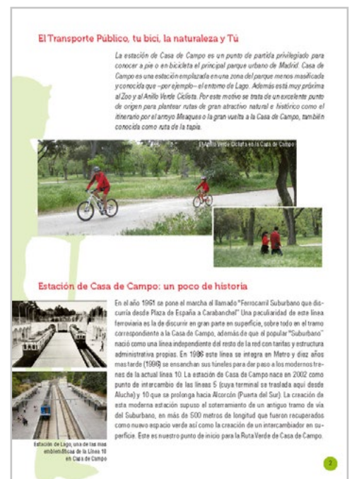
Ejemplo de libro de ruta descargable en PDF por el excursionista