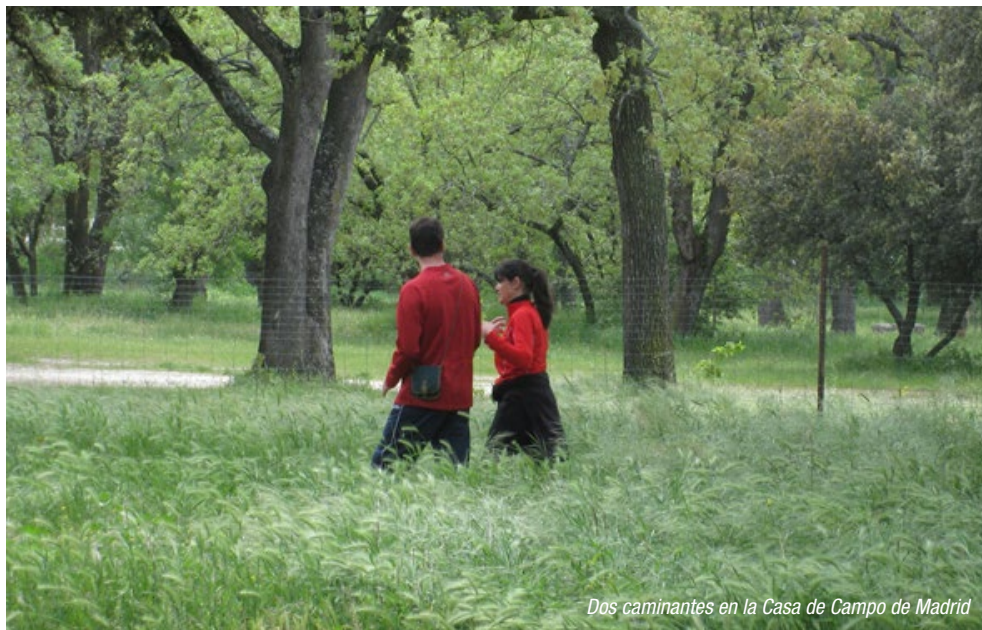
Dos caminantes en la Casa de Campo de Madrid

El programa de Rutas Verdes comenzó en 2011 con la edición del libro de ruta desde la estación de Príncipe Pío, punto de acceso a la nueva zona de Madrid Río, uno de los espacios verdes más populares de Madrid. Desde entonces y hasta ahora han sido 47 rutas con cerca de 800 kilómetros en total las editadas bajo la marca “Ruta Verde”, siendo muchas de ellas verdaderas sorpresas al poner en valor zonas no muy conocidas por los madrileños y sin embargo accesibles en transporte público.