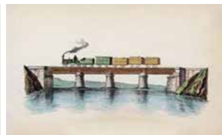
Ilustraciones F.C. Madrid-Aranjuez 1851

El FC Madrid-Aranjuez. En el último tramo de la ruta, entre Ciempozuelos y Valdemoro tendremos en la margen izquierda el trazado de la línea férrea Madrid-Aranjuez, construida en 1851. Por esta línea circula el conocido ferrocarril de la Fresa que en fines de semana rememora las épocas gloriosas de los primeros trenes y que es una buena opción para disfrutar de un día en Aranjuez.