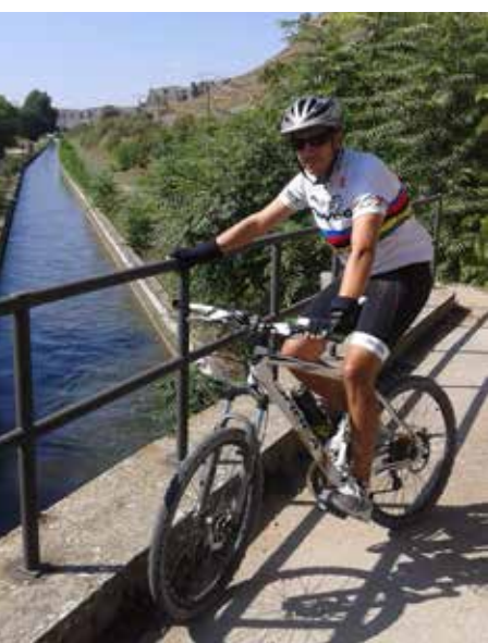
Canal del Jarama

San Martín de la Vega (kilómetro 20,6). El canal pasa a estar cubierto en la travesía del casco urbano pero es fácil seguir su rastro por dos amplias avenidas ajardinadas: la Av. de la Natividad y la Av. del Doce de Octubre.