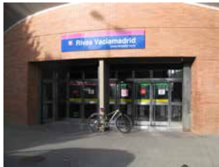
Estación de Rivas Vaciamadrid

147 años separan la construcción, en 1851, de las estaciones ferroviarias de Valdemoro y Ciempozuelos de la estación de Rivas Vaciamadrid, acaecida en 1998. Este salto en el tiempo no lo vamos a notar en nuestro viaje ya que tanto a la ida como a la vuelta de la ruta viajaremos en modernos y confortables trenes de las redes de Metro y Cercanías.