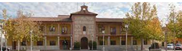
San Martín de la Vega

Carreteras M-301 y M-506 (kilómetro 20). En apenas unos metros el canal, y por tanto la pista que estamos siguiendo, cruzan a nivel con la M-301, más adelante bajo el puente del antiguo ferrocarril, y por último cruza la M-506. Seguimos junto al canal en dirección al casco urbano de San Martín de la Vega.