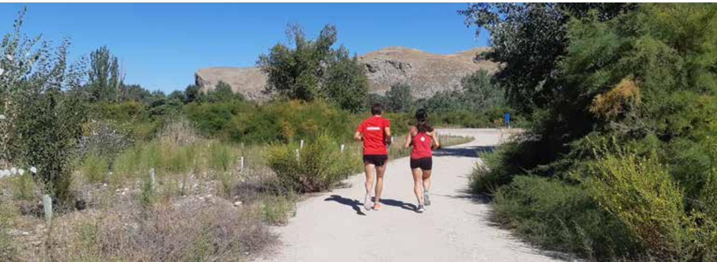
Subiendo a Valdemoro