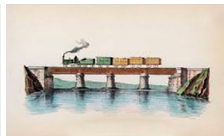
Ilustraciones F.C. Madrid-Aranjuez 1851

El FC Madrid-Aranjuez. En el último tramo de la ruta, entre Ciempozuelos y Valdemoro tendremos en la margen izquierda el trazado de la línea férrea Madrid-Aranjuez, construida en 1851. Por esta línea circula el conocido ferrocarril de la Fresa que en fines de semana rememora las épocas gloriosas de los primeros trenes y que es una buena opción para disfrutar de un día en Aranjuez.