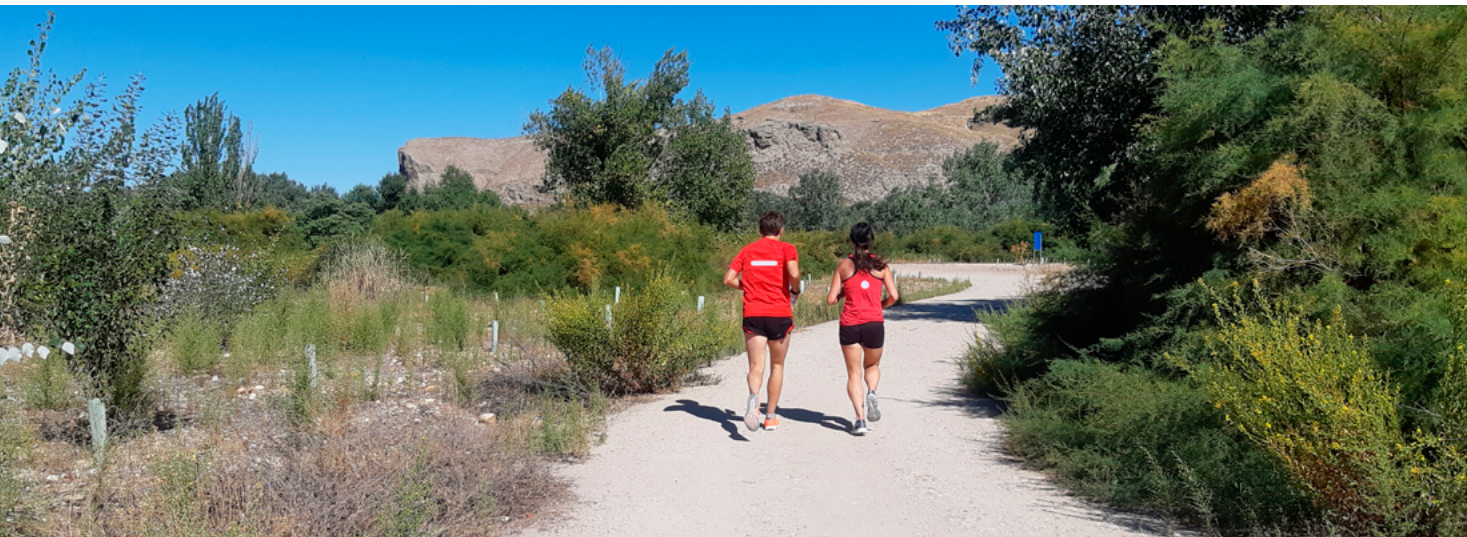
Subiendo a Valdemoro