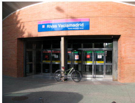
Estación de Rivas Vaciamadrid

147 años separan la construcción, en 1851, de las estaciones ferroviarias de Valdemoro y Ciempozuelos de la estación de Rivas Vaciamadrid, acaecida en 1998. Este salto en el tiempo no lo vamos a notar en nuestro viaje ya que tanto a la ida como a la vuelta de la ruta viajaremos en modernos y confortables trenes de las redes de Metro y Cercanías.