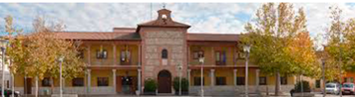
San Martín de la Vega

Carreteras M-301 y M-506 (kilómetro 20). En apenas unos metros el canal, y por tanto la pista que estamos siguiendo, cruzan a nivel con la M-301, más adelante bajo el puente del antiguo ferrocarril, y por último cruza la M-506. Seguimos junto al canal en dirección al casco urbano de San Martín de la Vega.