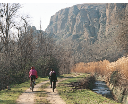
Canal de La Marañososa

Metro Rivas Vaciamadrid (kilómetro 0). Salimos de la estación hacia la rotonda y el paso inferior bajo la A3. Tomamos la salida en dirección Valencia y justo en la curva de acceso a la autovía, y en plena subida, veremos que a la izquierda se abre un camino que conduce a la Escuela de Protección Civil, unos viveros y al Soto de las Juntas. Precaución con los automóviles al girar a la izquierda para tomar el camino.