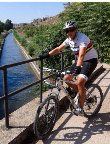
Canal del Jarama

San Martín de la Vega (kilómetro 20,6). El canal pasa a estar cubierto en la travesía del casco urbano pero es fácil seguir su rastro por dos amplias avenidas ajardinadas: la Av. de la Natividad y la Av. del Doce de Octubre.